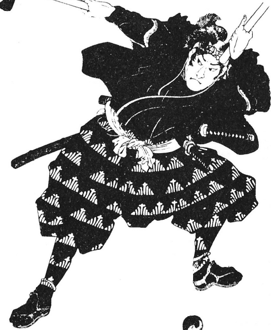
SHIN DO MUSO RYU