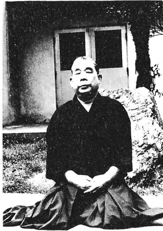
SHIMIZU TAKAJI - 25 e SÔKE : SHIN DO MUSO RYU