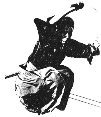
TENSHIN SHODEN KATORI SHINTO RYU