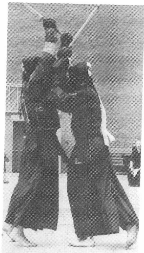
En situationsbild från EM.