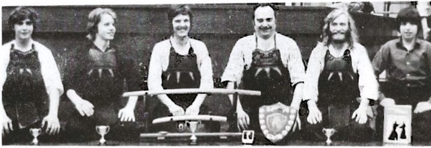
Härintill fr. v. Tredje pristagare, andrapri- stagaren Lasse, förste pristagaren, fighting spiritpristagaren, tre- jepristagaren och er- raren av specialpris Nedan i mitten: Staff- ettan och Gillegård t- an i vänskaplig förbr- ring.