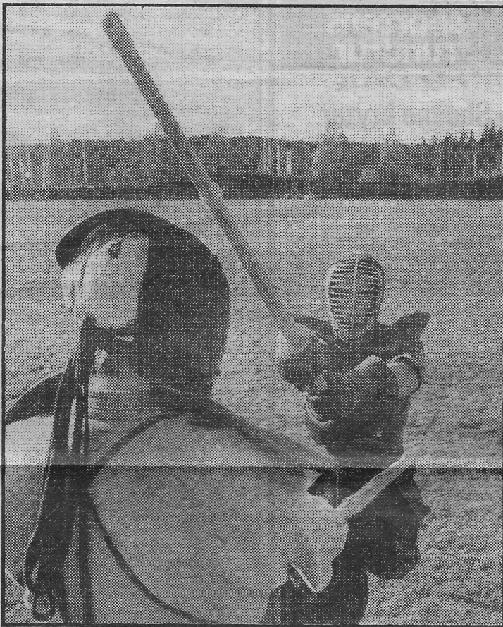
KENDO — visst ser sporten våldsamt ut. Men den är inte så farlig som den verkar.

— Just det. Faktiskt ett måste för att få högsta möj-