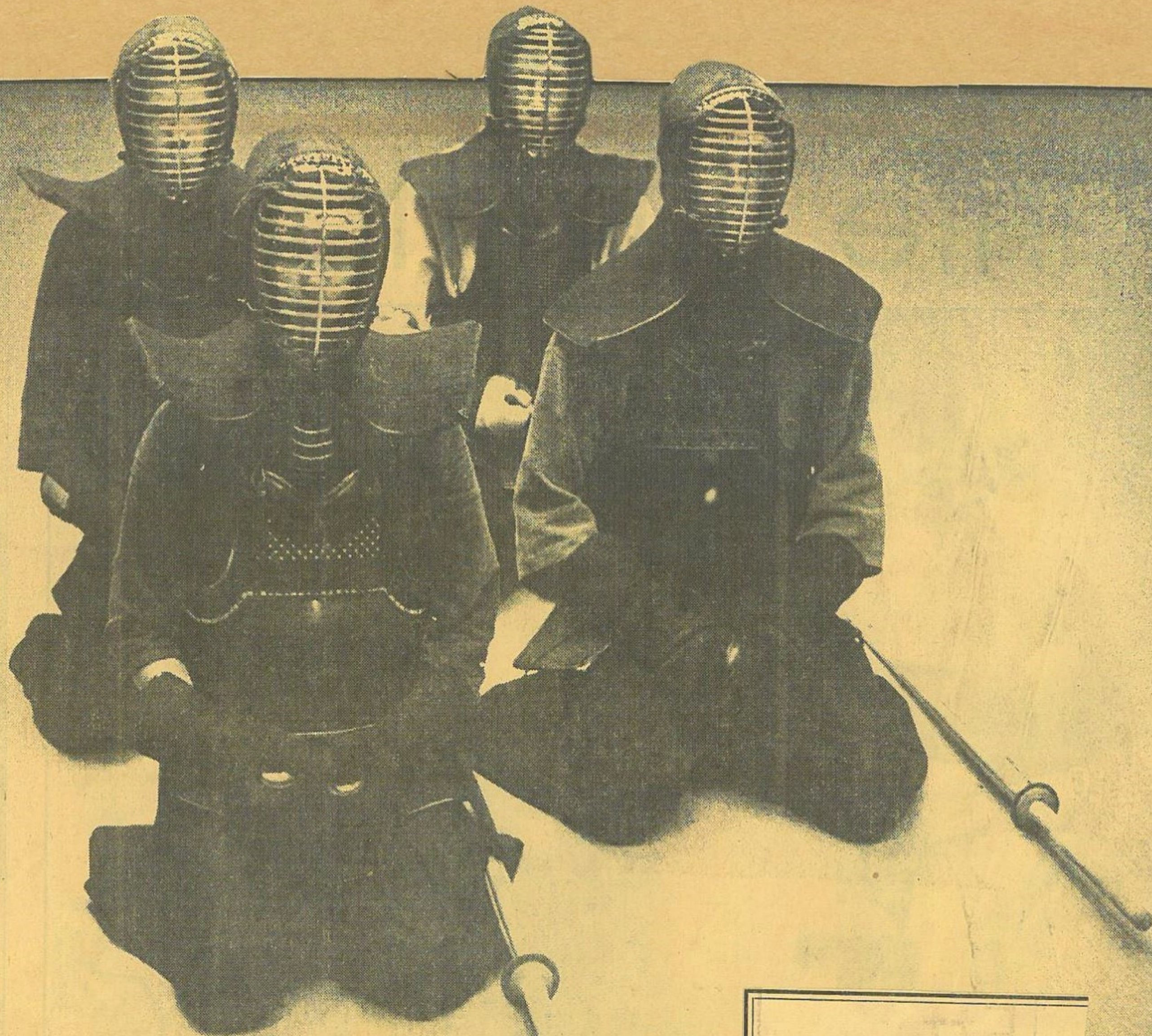
Skånska kendokas reglementsénligt utrustade och redo för kamp

□ Detta är inte vad det ser ut att vara, d v s blodtörstande, exotiska skräckfigurer. Bakom maskerna döljer sig nämligen skånska idrottsmän, invecklade i japansk käppfäktning med två händer, kendo.