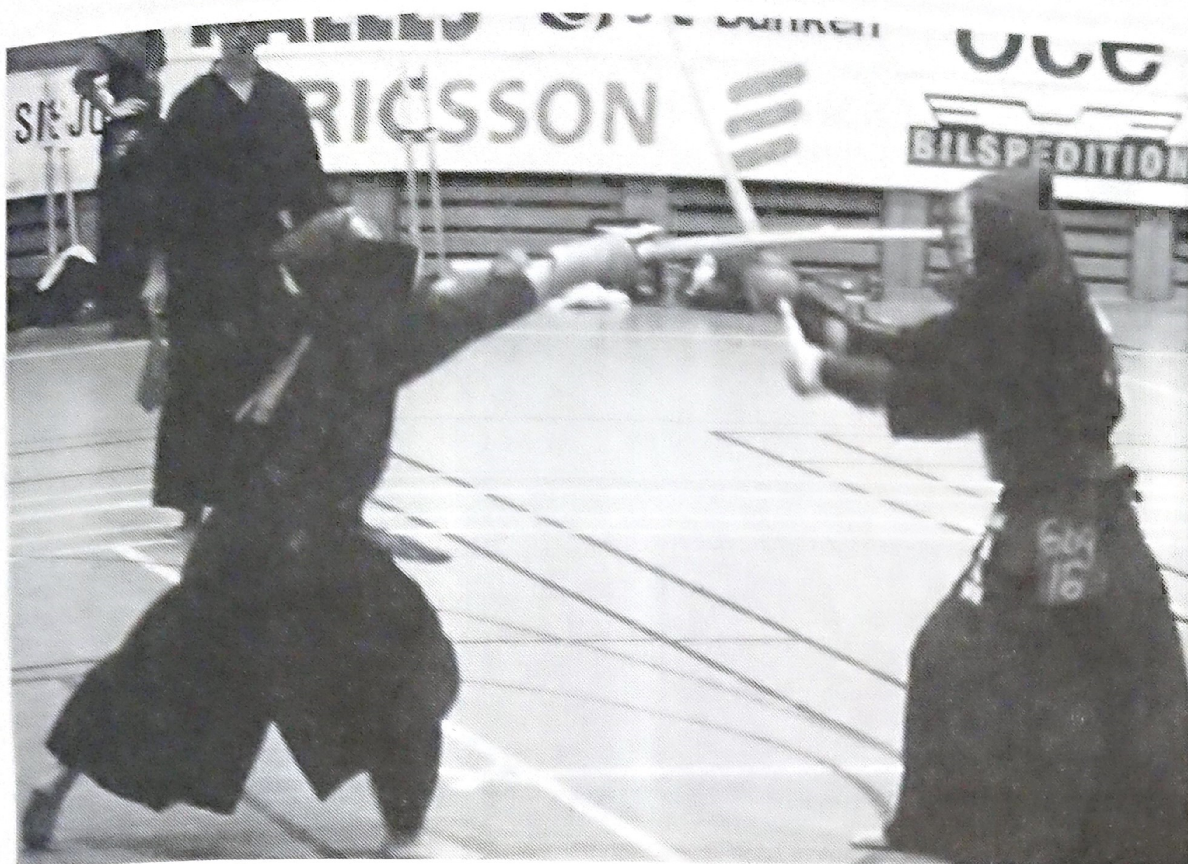
Kamperna var många och intensiva och kiai-ropen skallade i Lisebergshallen.