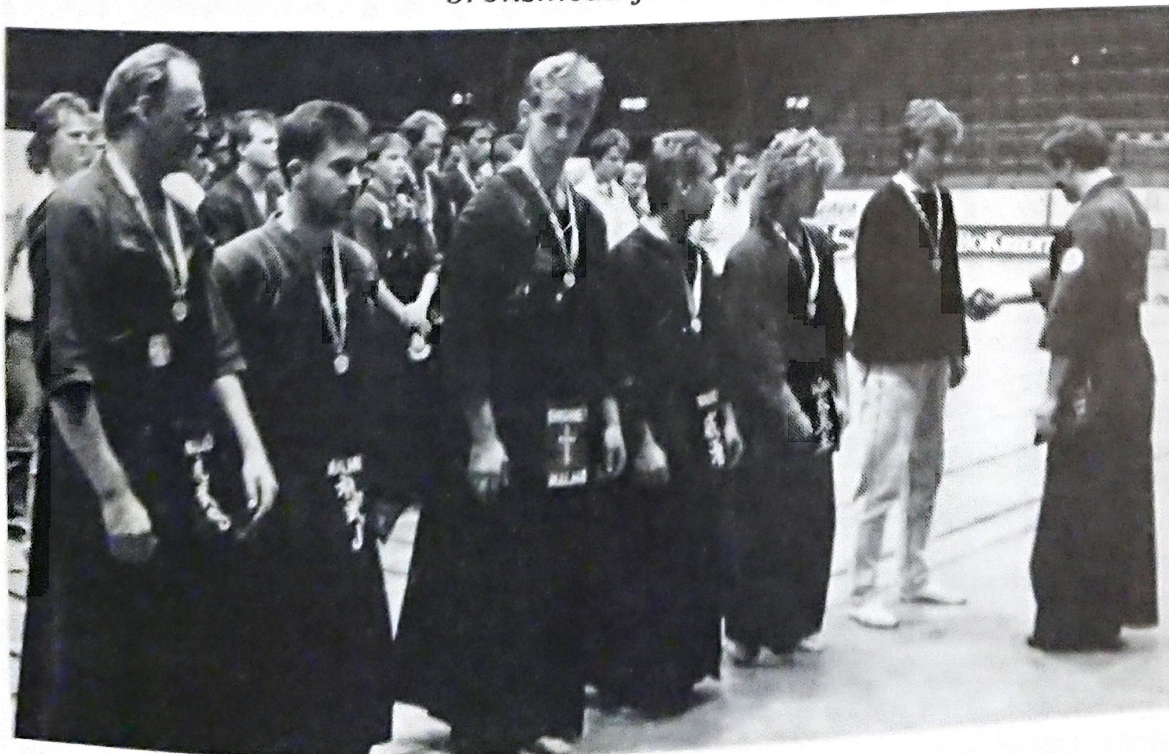
Det segrande laget GAK Enighet Malmö får sina SM-medaljer.