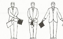
Nashi Avslag, ingen poäng