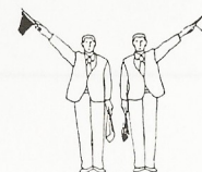
Ippon Poäng för röd eller vit