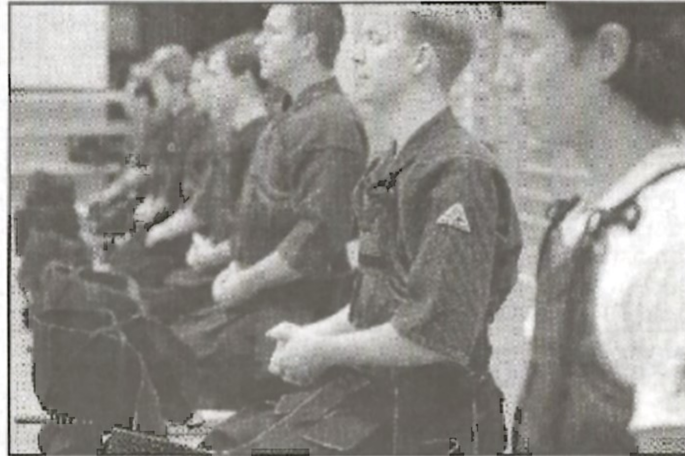
Balans, harmoni och koncentration. Kendon omges av japanska ritualer och kräver inre samling inför matchen.