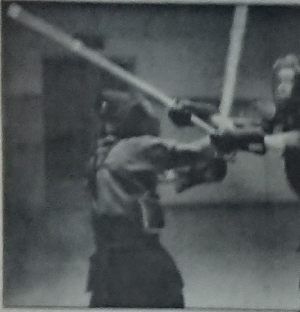
— Kurita! vräklar domaren och det betyder något i sål med "ta i nu då" på japanska. Och hämparna sätter in den ena stöten efter den andra.

Första slaget markerar att skallen klyvs. I det andra åker underarmarna, i det tredje kapas kroppen på mitten.