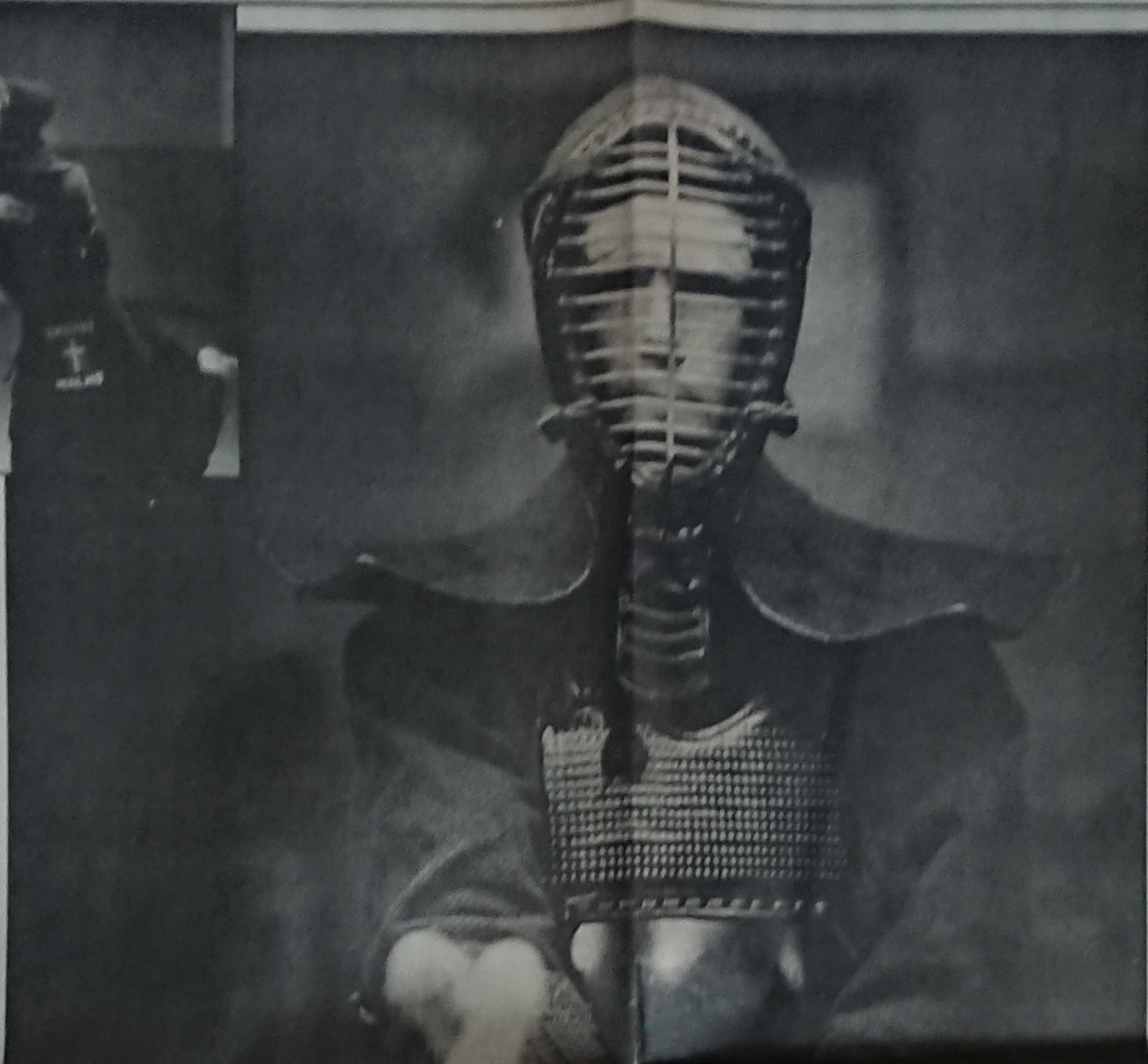
För utomstående är kendo mest härd för driften — en underlig kläddräkt som sett osäker likadant ut sedan 1700-talet.

— Det är en poäng, en poäng. — Det är en poäng, en poäng. — Det är en poäng, en poäng. — Det är en poäng, en poäng.