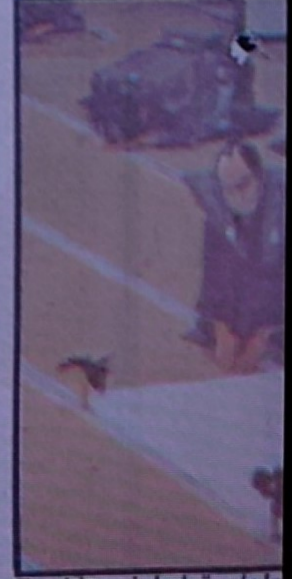
En klassisk handels-teatrar. Under audi hans samurajer. Sa förbjudet att dra svä död och samuraje