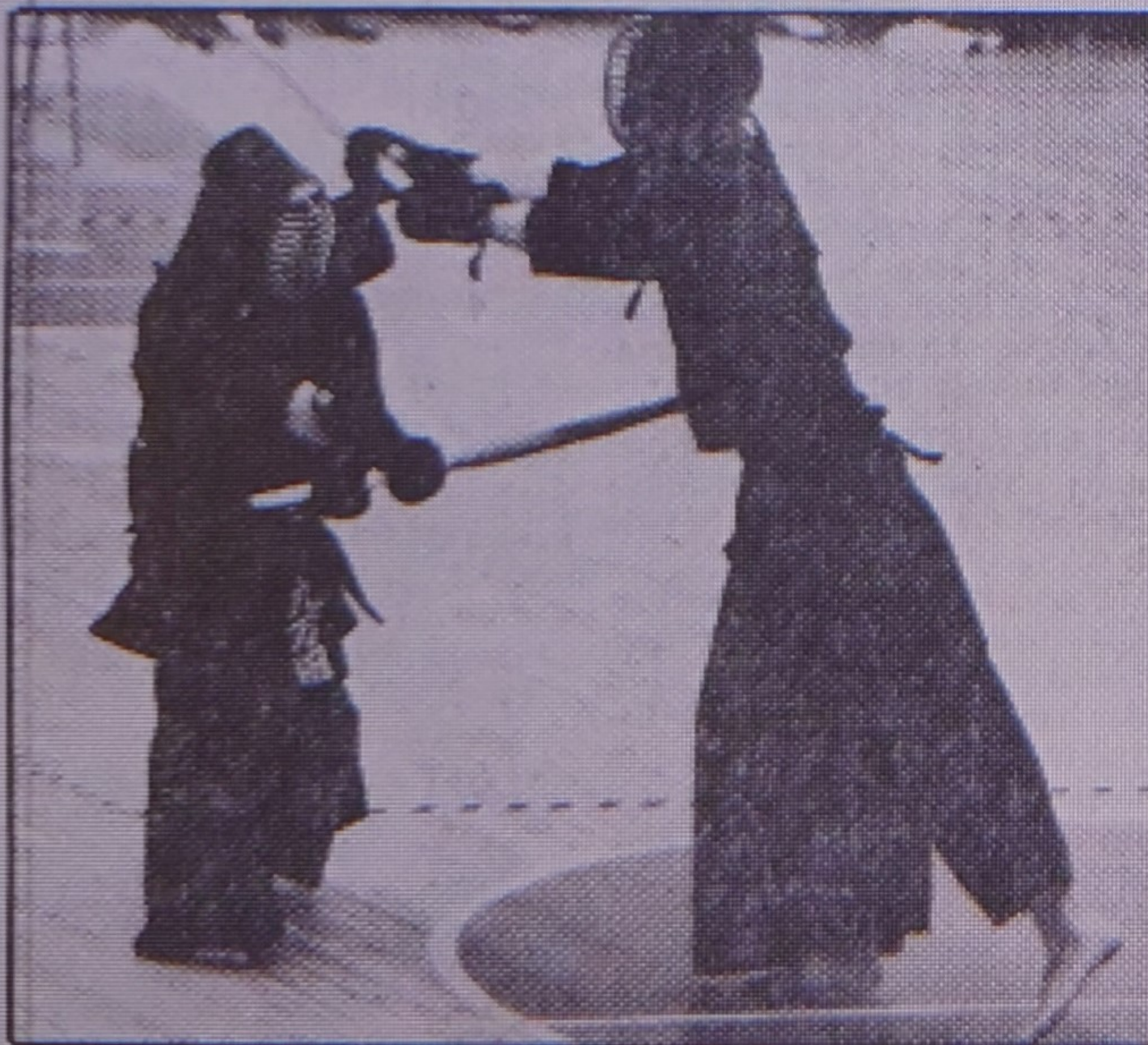
Kendo utövas med mask och andra skydd för att de stridande inte skall göra varandra illa. Hiskeliga vrål ingår i spelet.