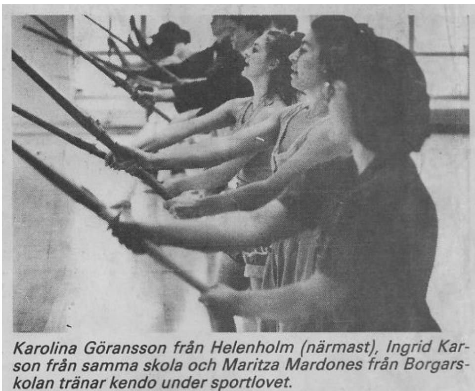
Figur 1 - Från Arbetet 23 februari 1989

Hon tog 4 Dan 2007 i samband med ett Hirakawa-läger i Köpenhamn, på 4e försöket. En detalj från 4 Dan graderingen var att alla fick göra om sin kendo kata då ingen höll en rak linje vid första försöket.