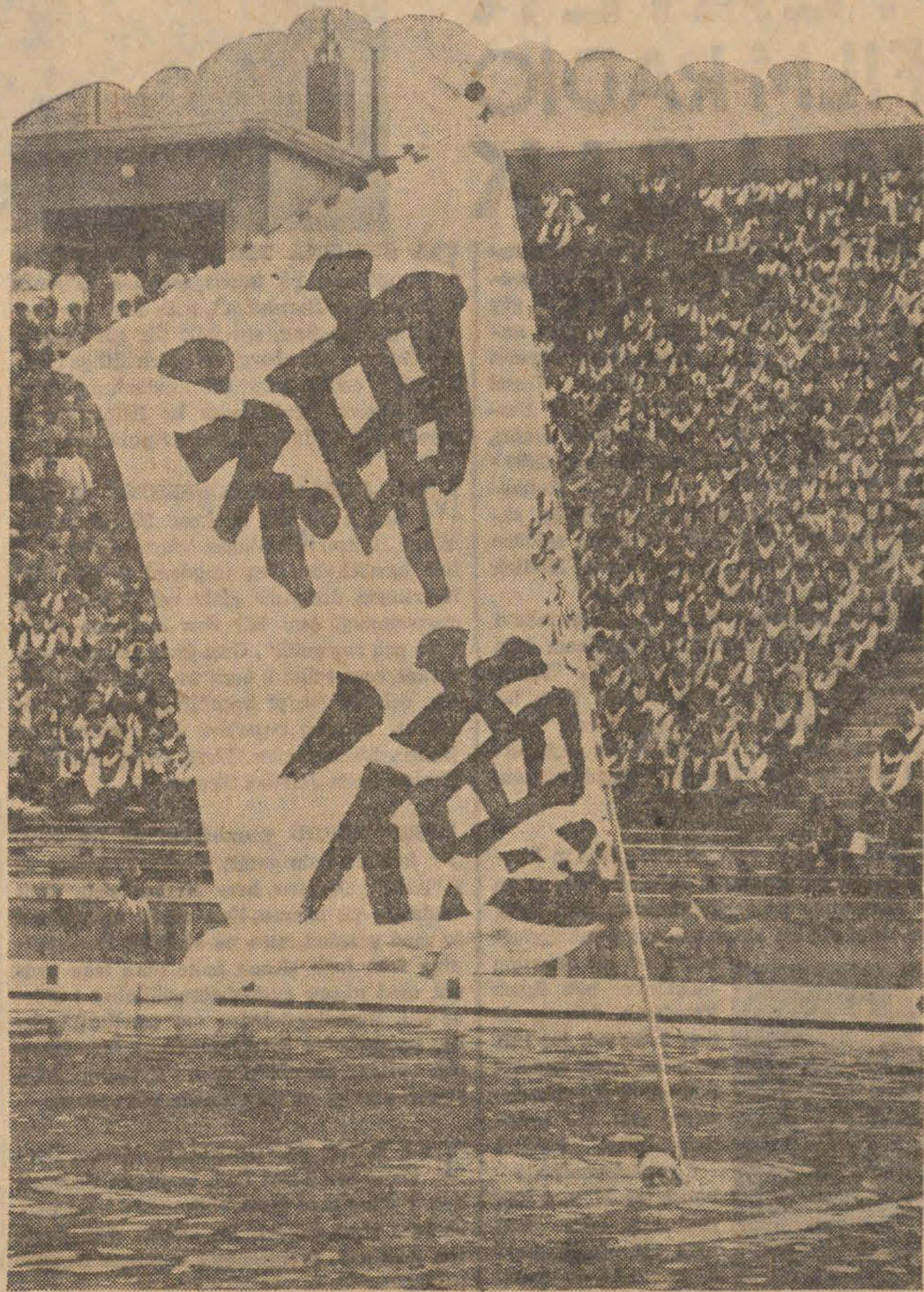
Klart för start i ett större japanskt simmarmeeting, ena målflaggan vaktad av en naja; på läktarna sitta de tävlandes klubbkamrater som smultron tätt, väl rättade så att man inte behöver missta sig på att man befinner sig i ett militärland.

att Japan f. n. har 15 idrottsborgar, som rymma från 30.000 till 60.000 platser. Men