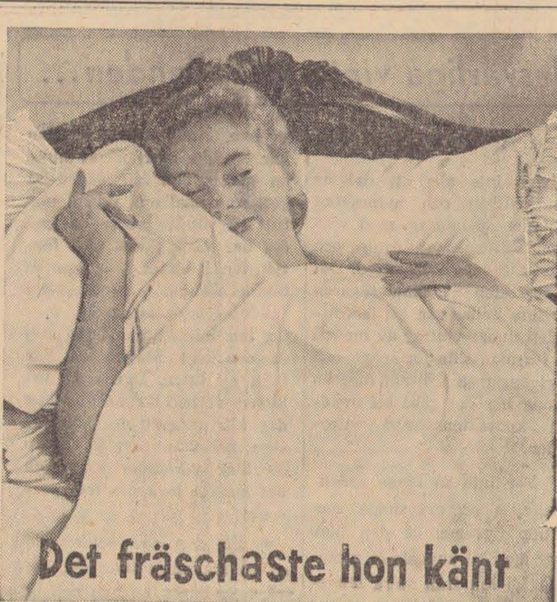
Det fräschaste hon känt

Under den senaste tiden har en utredning verkställts om möjligheterna för bildandet av en föreläsningförening i Lin-