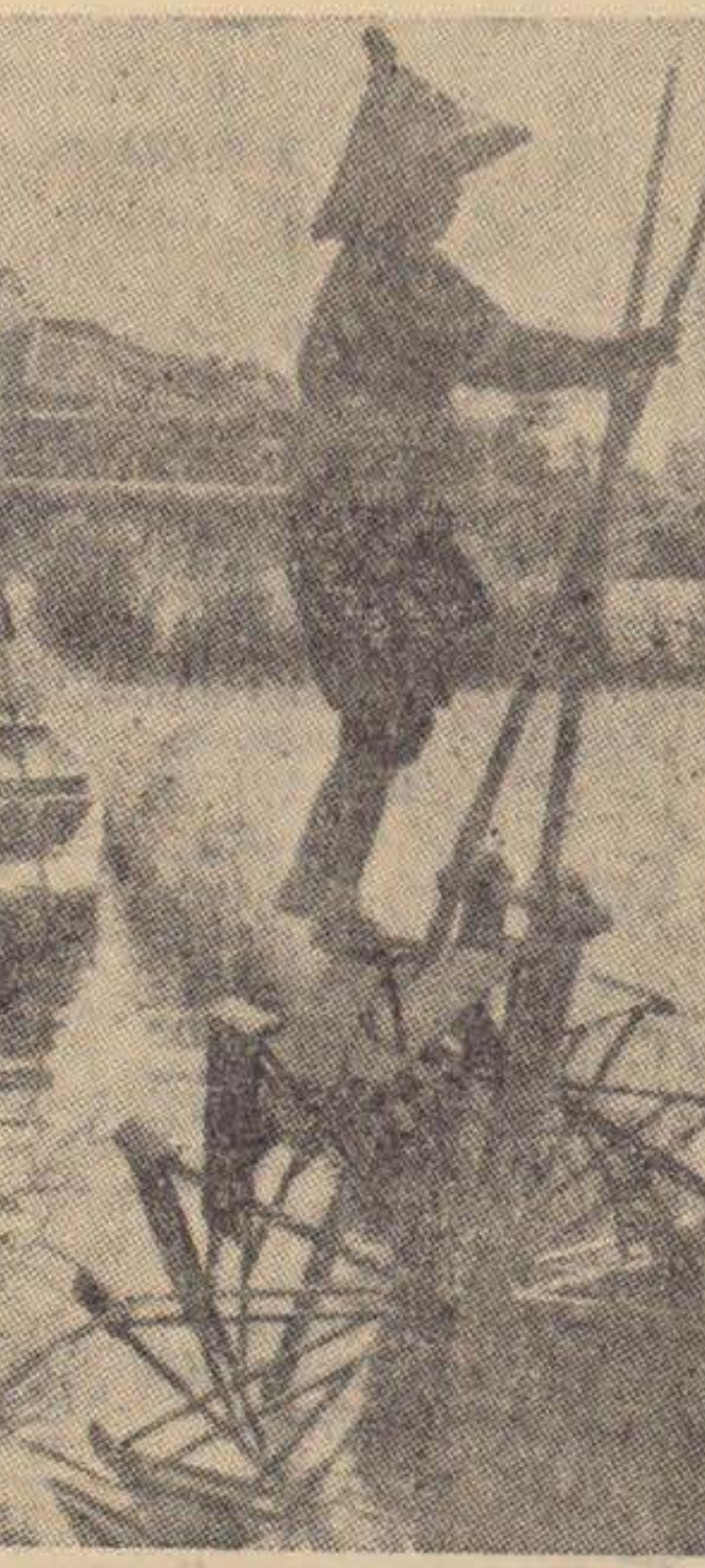
Riset spelar en stor roll för den japanska folksörjningen. Här nedan pumpas vatten till risfälten med vattenjul.

DEN UNGA FLICKAN måste också vara skicklig i att arrangera blommor. Blomsterarrangemanget har sitt ursprung i bruket att offra blommor på familjaltare till de avlidna sedan.