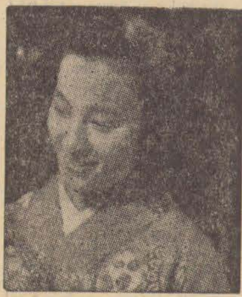
Vi lär oss tidigt att arrangera blommor, säger den här unga japanska flickan leende.

SEDAN GAMMALT har det rått ett speciellt familjesystem i Japan. I de flesta fall bodde den äldste sonen och hans familj tillsammans med föräldrarna och de