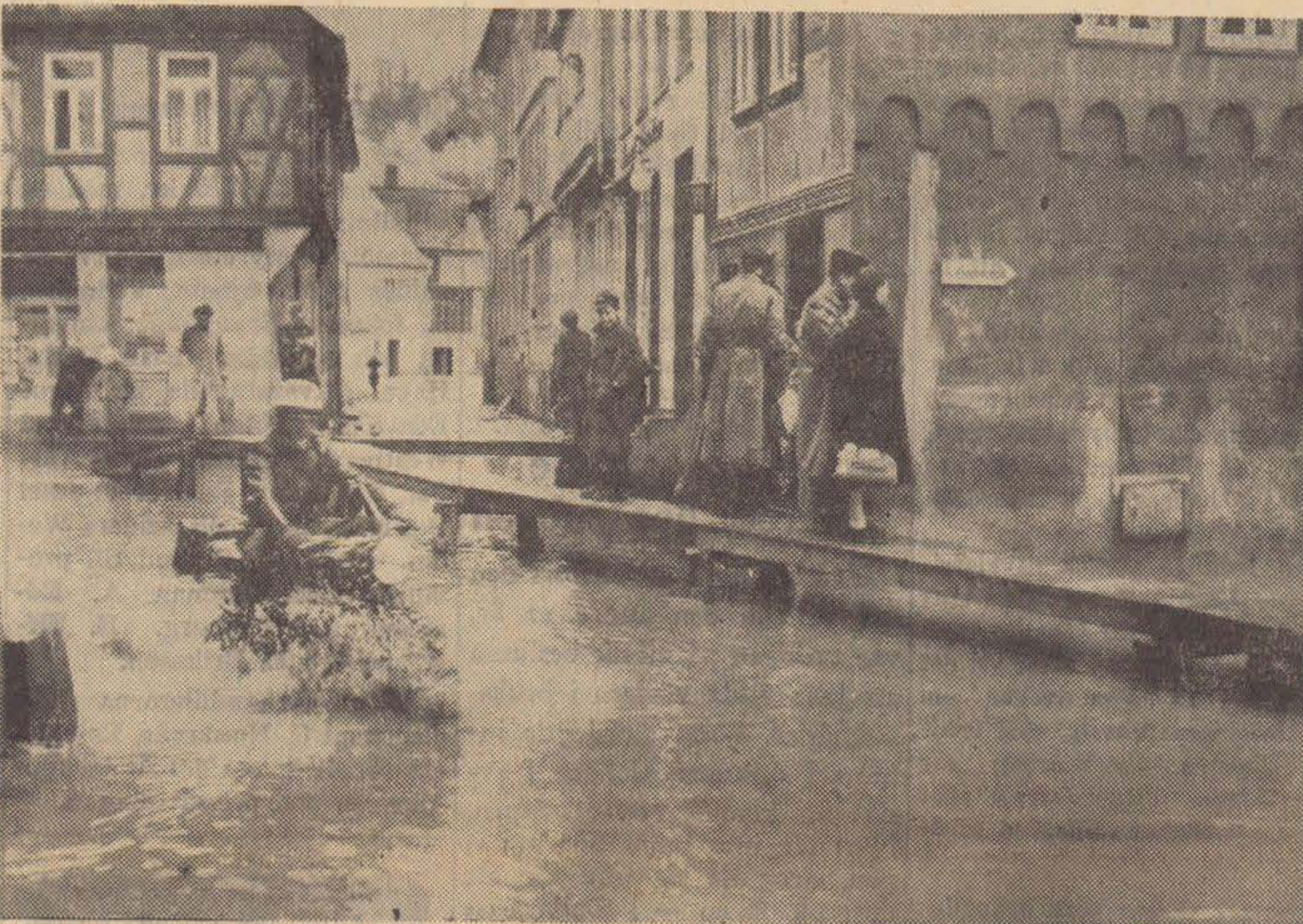
Den förödande värfloden i Tyskland och Österrike synes utveckla sig med stor snabbhet. Tusentals människor har tvingats från sina hem och flera byar och städer är helt isolerade. Bilden visar en översvämmande gata i staden Diez nära Limburg i Tyskland.