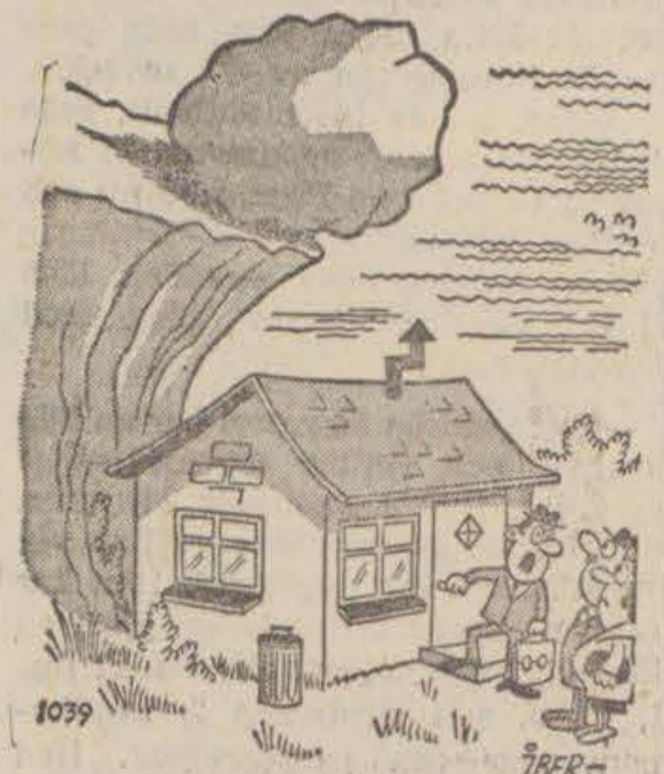
Stäng för all del dörren med största försiktighet.

Dagens namn: FINGAL Solen: upp 6.33 ned 16.56