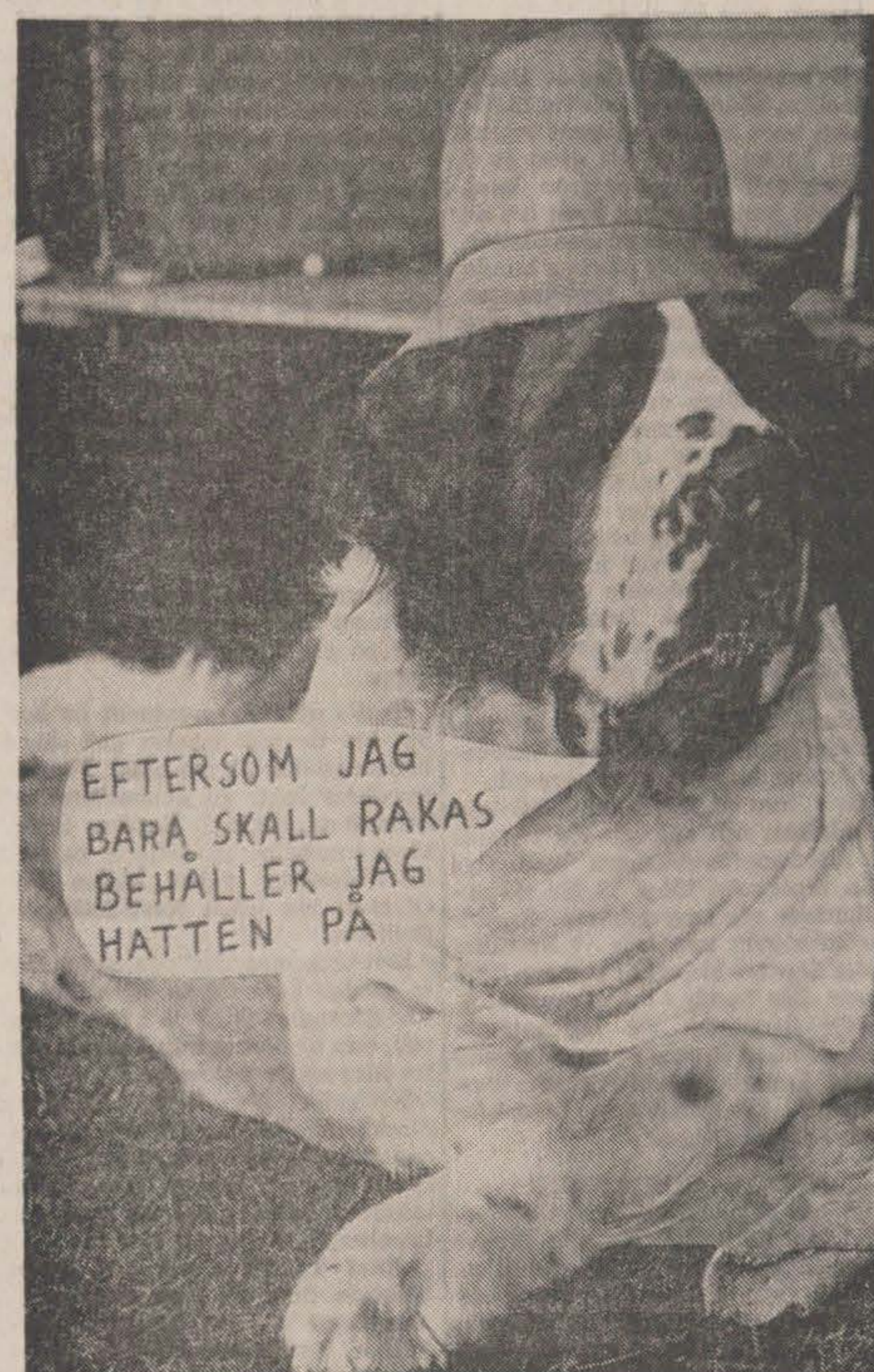
EFTERSOM JAG BARA SKALL RAKAS BEHÅLLER JAG HATTEN PÅ

Ett sällskap bilande turister kom till en liten by i utkanten av civilisationen. Där blev de visade platsens sevärdheter, bl.a. en gubbe som var i det närmaste 100 år. De underhöll sig med gubben en bra stund, och när han tog advå sa han: - Skulle det vara så att herrskapet ska fortsätta till nästa by. Så kunde jag kanske få följa med. Jag jobbar nämligen som äldsta invånare i den byn också!