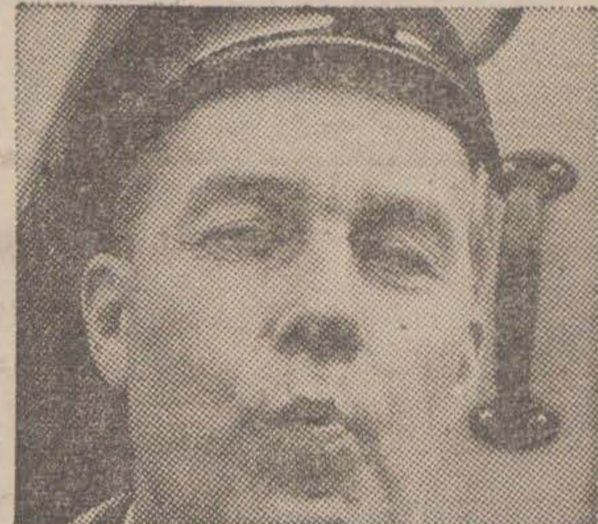
En väldigt frisk smak