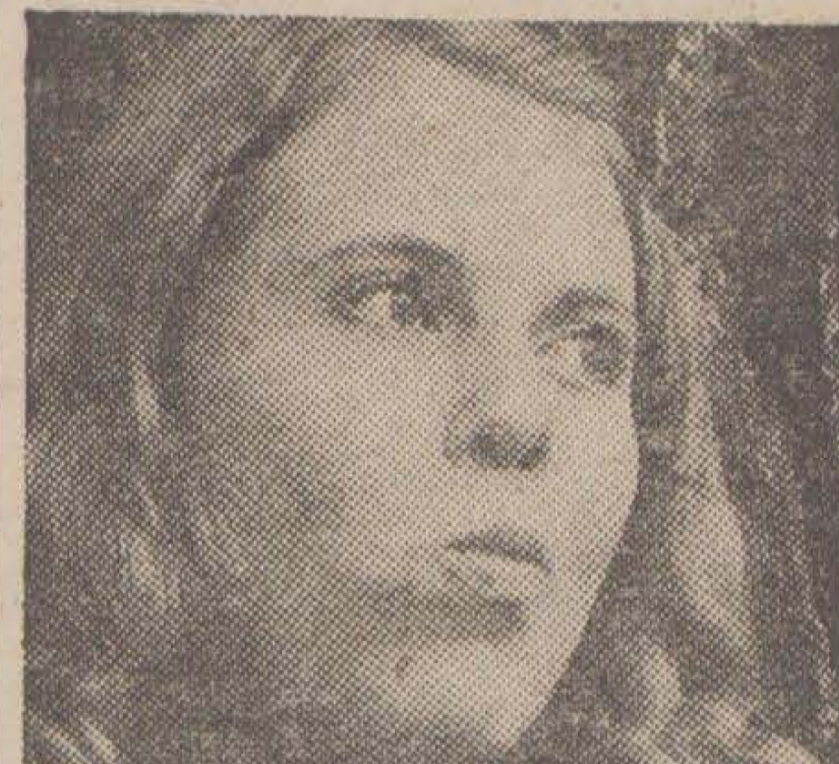
Mintsmaken känns fastän man är förkyld