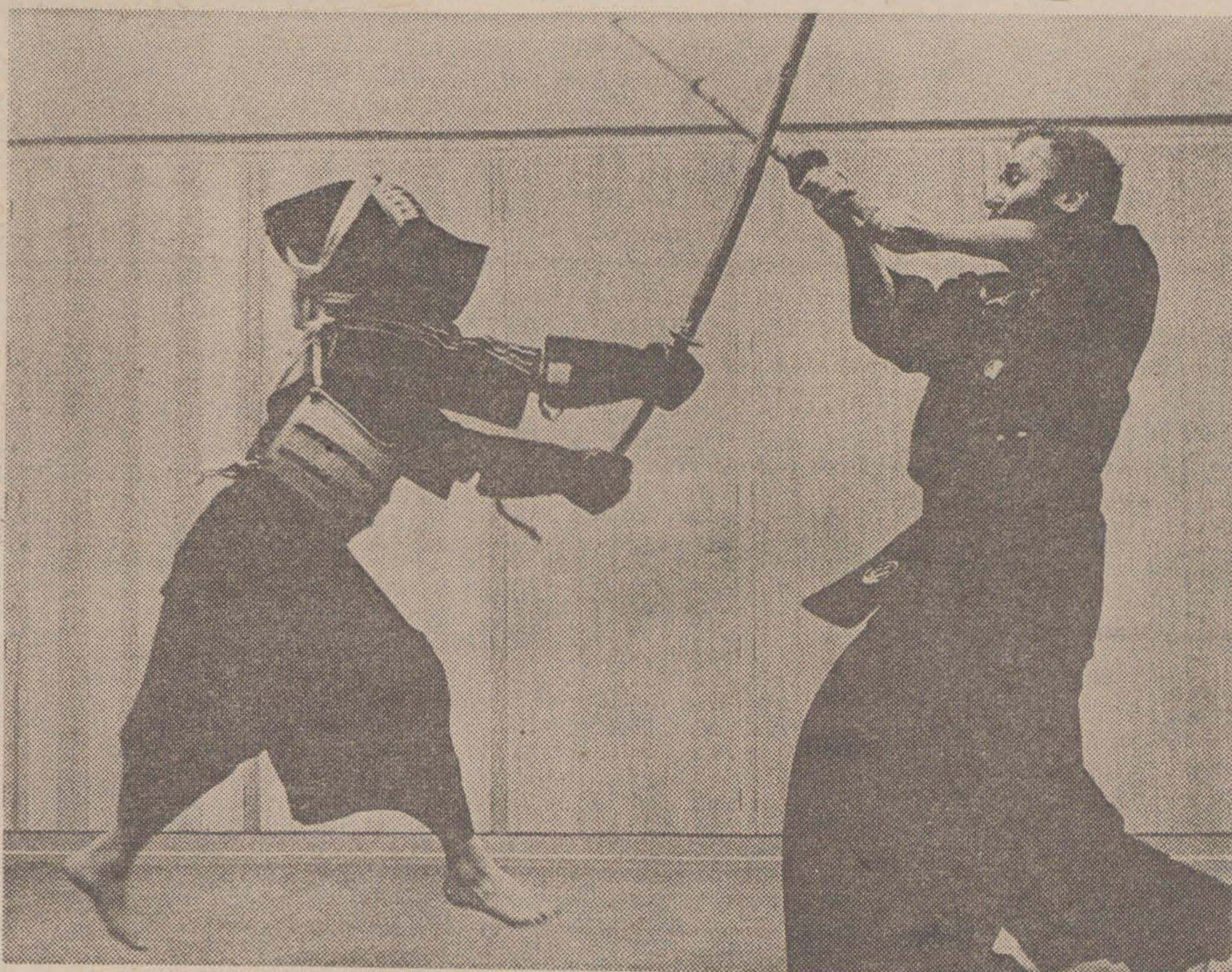
Barn som ägnar sig åt japansk svärdfäktning, kendo, får ökat självförtroende och de lär sig ta hänsyn och vara artiga. Det finns inte mycket plats för mobbning.

— Eftersom den japanska inredningen, den japanska atmosfären i träningslokalerna är lika främmande för både svenskfödda barn och invandrabarn och eftersom alla är klädda likadant blir det inte på samma sätt som annars fråga om några avvikande individer. Vi vill därför ha