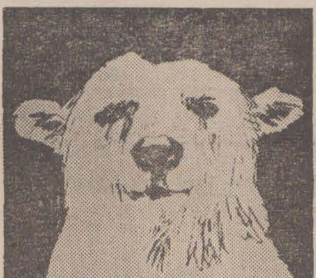
Det bästa jag vet