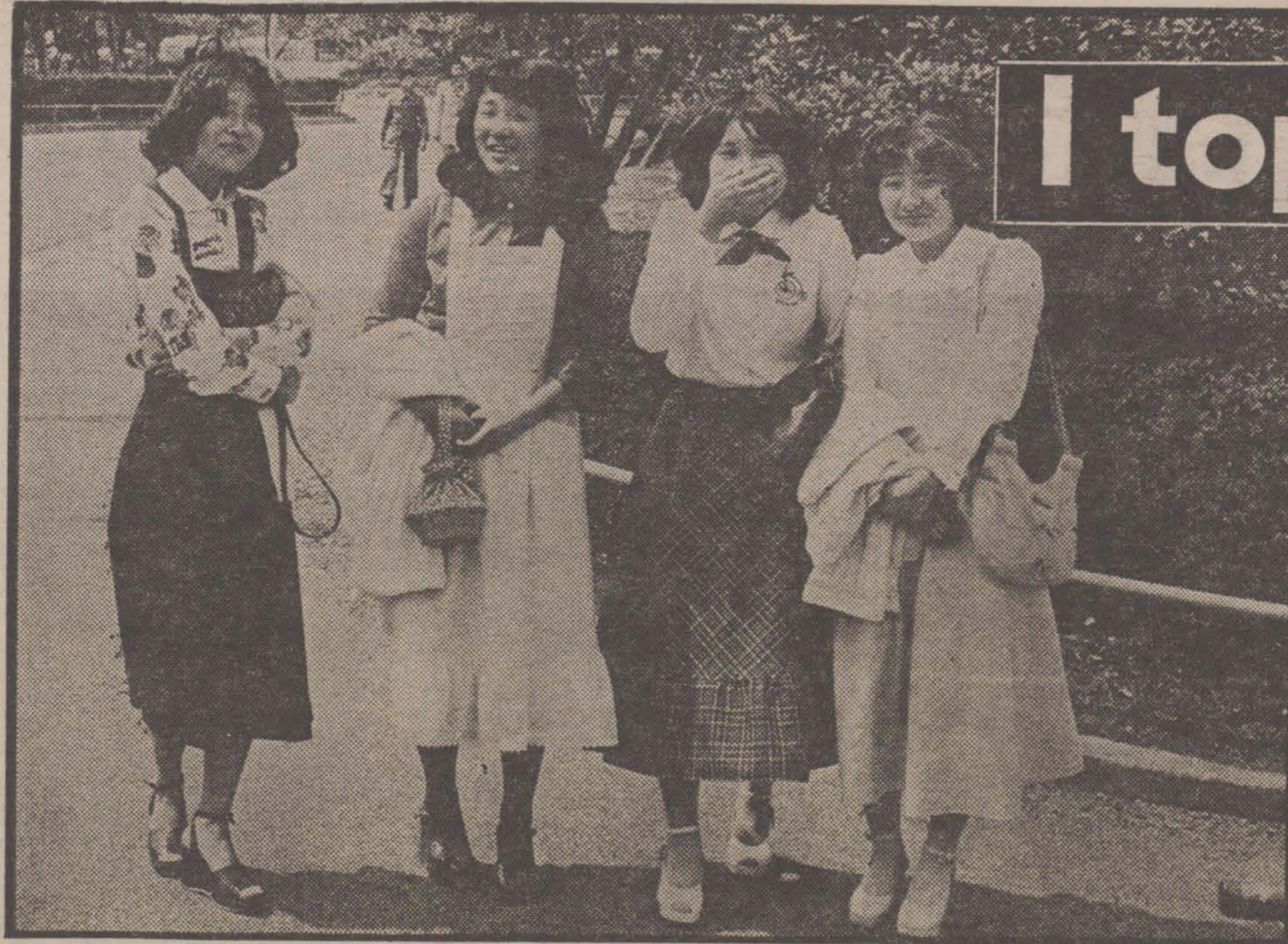
• Fyra fnittrande jäntor på finpromenad en söndag i Kejsarens park i Tokyo — Inte i Paris! De är alla klädda efter det sista västerländska skriket. Ljusblå, skära, rödrutiga, svarta långkjolar. Likadana skor med kilklack och plåt. Alla fyra har remmar i kors på hälen.