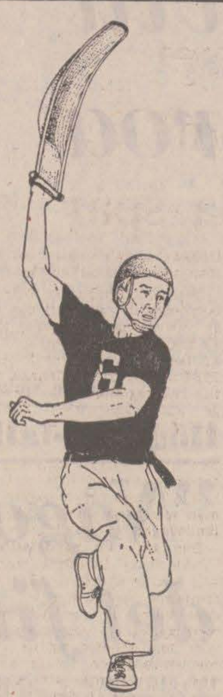
Pelotaspelare (ur "IPC:s Stora Sportlexikon")

Skulle nu lösarna få en brinnande lust att omväxling mot korsordslösandet fördriva tiden med lite jaialaispel, så låter det sig tyvärr knappast göra i en handvändning, om reglerna för spelokalens beskaften strikt ska följas. Jai alai spelas nämligen i en 54 meter lång hall med tre 12-14 meter höga vägar, varav frontväggen utgörs av granitblock och de två andra och golvet är gjutna i betong. Vi tror inte att någon kommun ens i valider skulle våga anslå medel till en massiv sportanläggning, om den inte samtidigt möjliggjorde kunde fungera som skyddsrum. Nej, jai alai har säkert inga förutsättningar att bli en