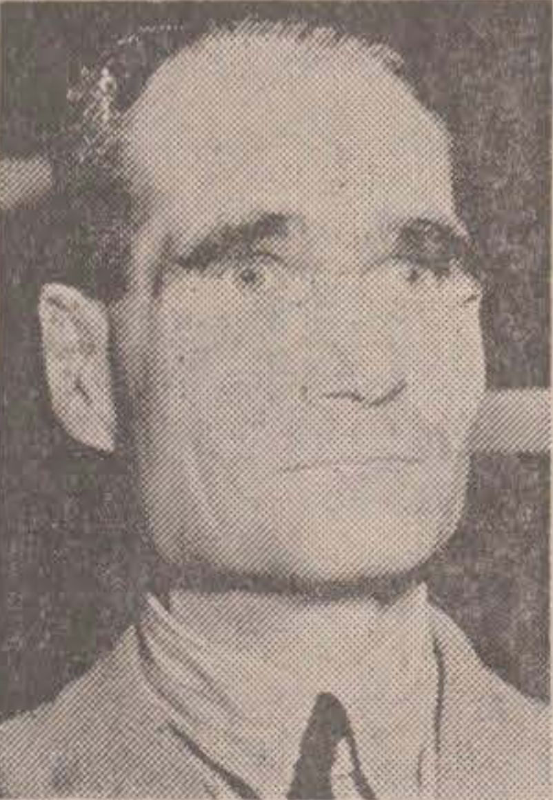
Rudolf Hess — så såg han ut vid Nürnbergrättegången i november 1945.

FÖR EN DEL år sedan föregicks en undersökning bland norska studenter där det framkom en närmast chockartad brist på kunskaper i världshistoria av senare datum. Man hade t.ex. ytterst diffusa begrepp om även om Adolf Hitler var och även om det rörde sig om en efterkrigs generation så borde namnet vara välbekant, speciellt som Norge var ockuperat av Hitler-Tyskland i 5 långa år och där det, mitt i Oslo, finns ett museum från denna tid där man bl.a. kan höra landsförrädaren Vidkun Quislings röst när han i ett ra-