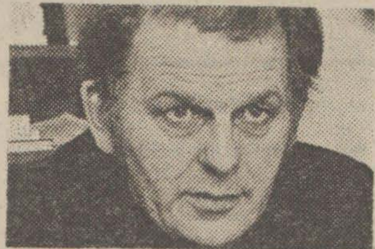
• Thorbjörn Fälldin

Äntligen har, bland annat genom Fälldins agerande, valdebatten kommit att röra sig om det väsentliga i valet i höst — nämligen: Skall vi ha ett socialistiskt samhälle av öststatsmodell eller fri företagsamhet av västmodell?