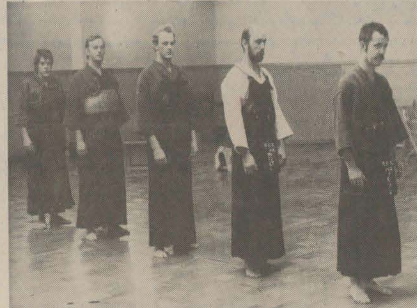
Här är malmölaget i kendo före matchen...