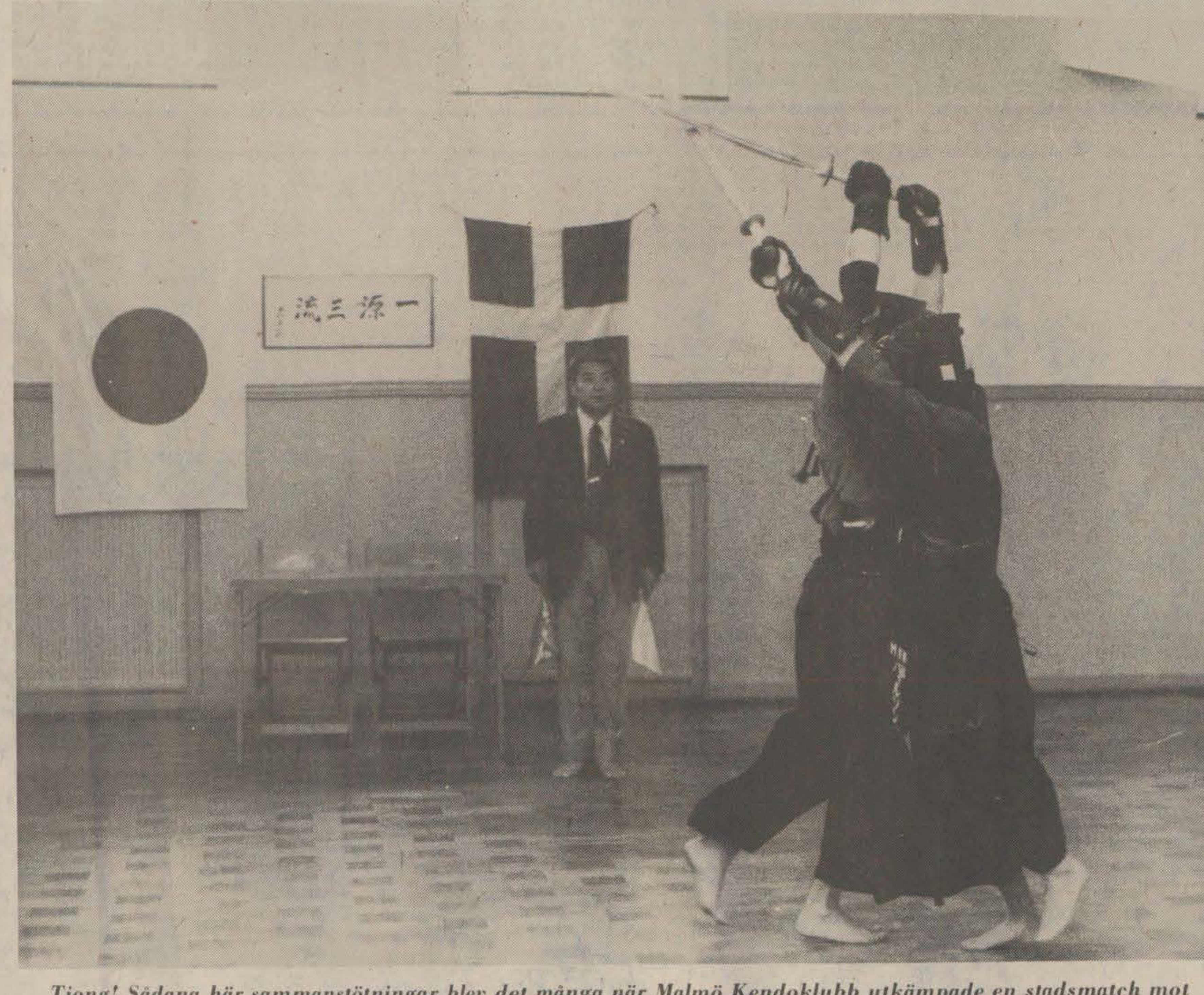
Tjong! Sådana här sammanstötningar blev det många när Malmö kendo-klubb utkämpade en stadsmatch mot Stockholm i Malmö på lördagen. I kendo är alla deltagare barfota - även domaren!

Malmö: Det räcker med att blunda och titta på en match i den här sporten för att blodet ska isas i ådrorna. Dova, flörtande gutturala stridsrop på ett obegripligt språk. Aekompanjerat av ett häftigt trampande av nakna fötter. Och hårda, tjoft och sock om.