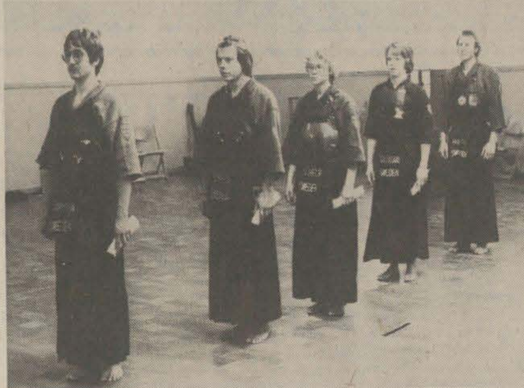
...och här är stockholm laget som hade en kvinnlig deltagare.