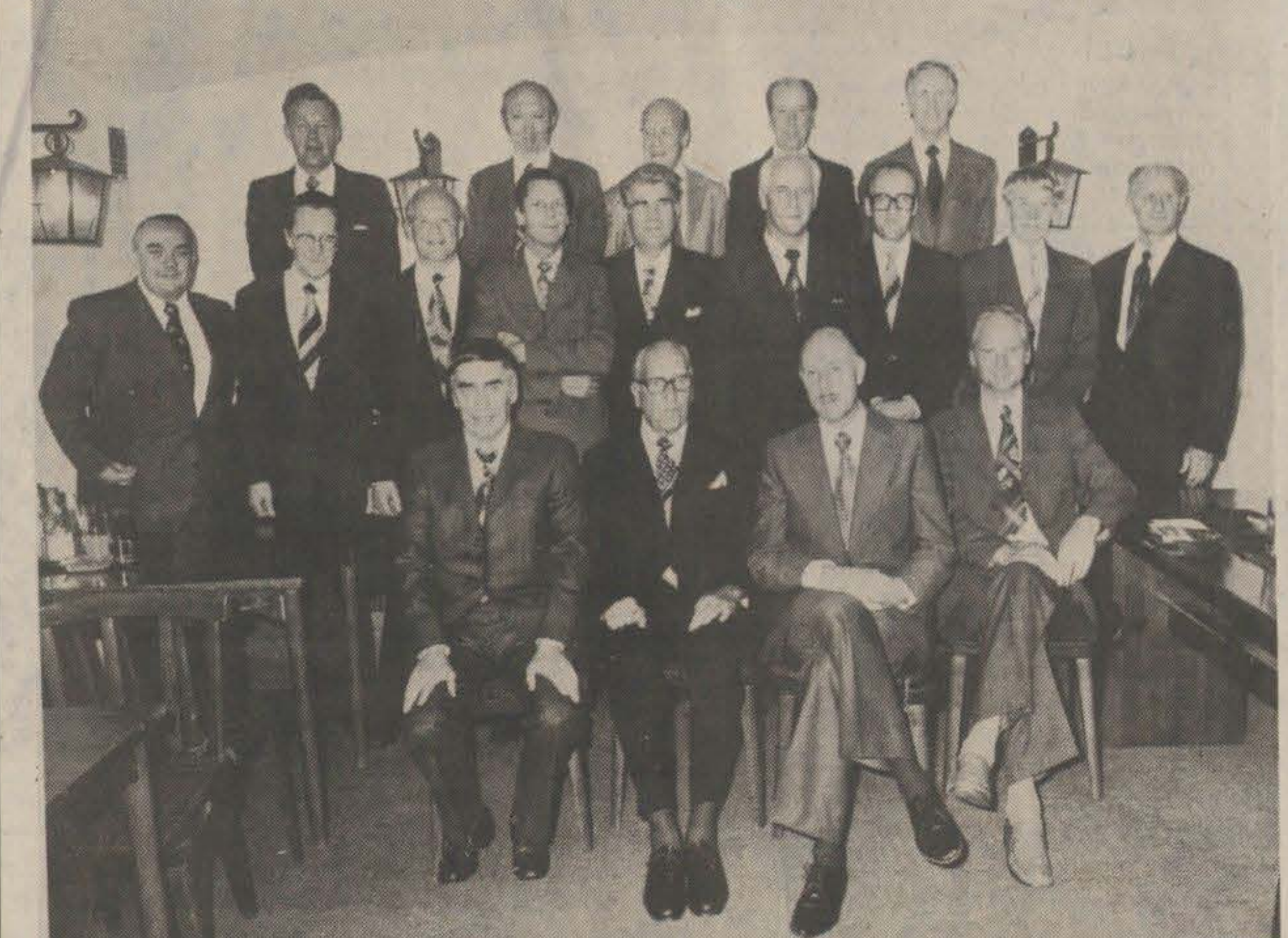
Allt går igen... Så här stod lokförarna för 25 år sedan. I går kväll var det dags igen i Kung Karls gillestuga.

Malmö: - Nu tutar vi och kör! sa fotografen och alla 18 lokförarna myste rart mot kameran. Och fattas bara - det var ju jubileum på gång!