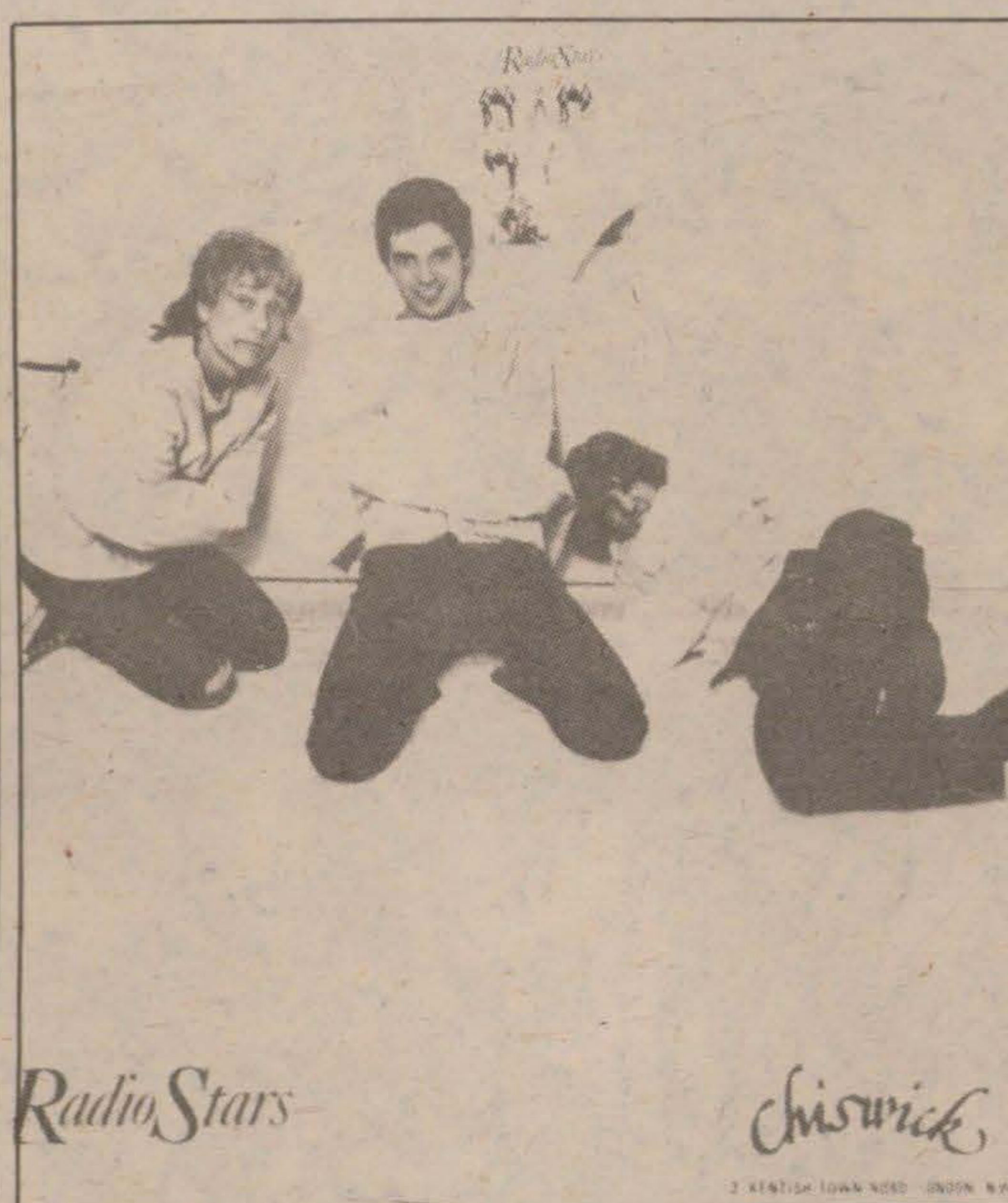
Ta inte den här gruppen på allvar. Radio Stars skriver inga intressanta texter, ingen lyssnar på orden ändå, säger gruppen.