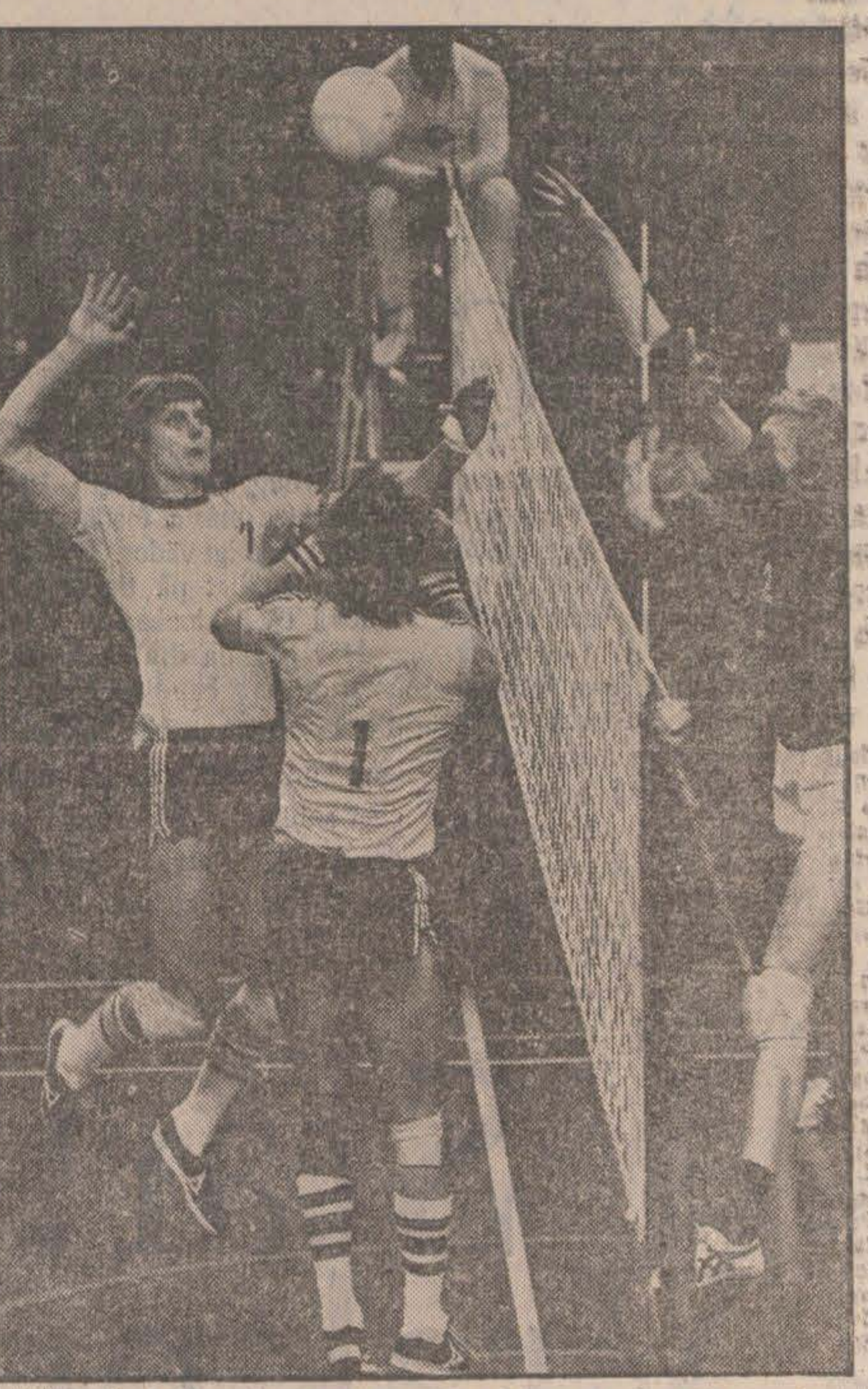
Basket, handboll och volleyboll är tre sporter där landslaget under 1979 spelat viktiga kvalificeringar. I handboll handlar det om OS-kval, i basket och volley om EM-kval.