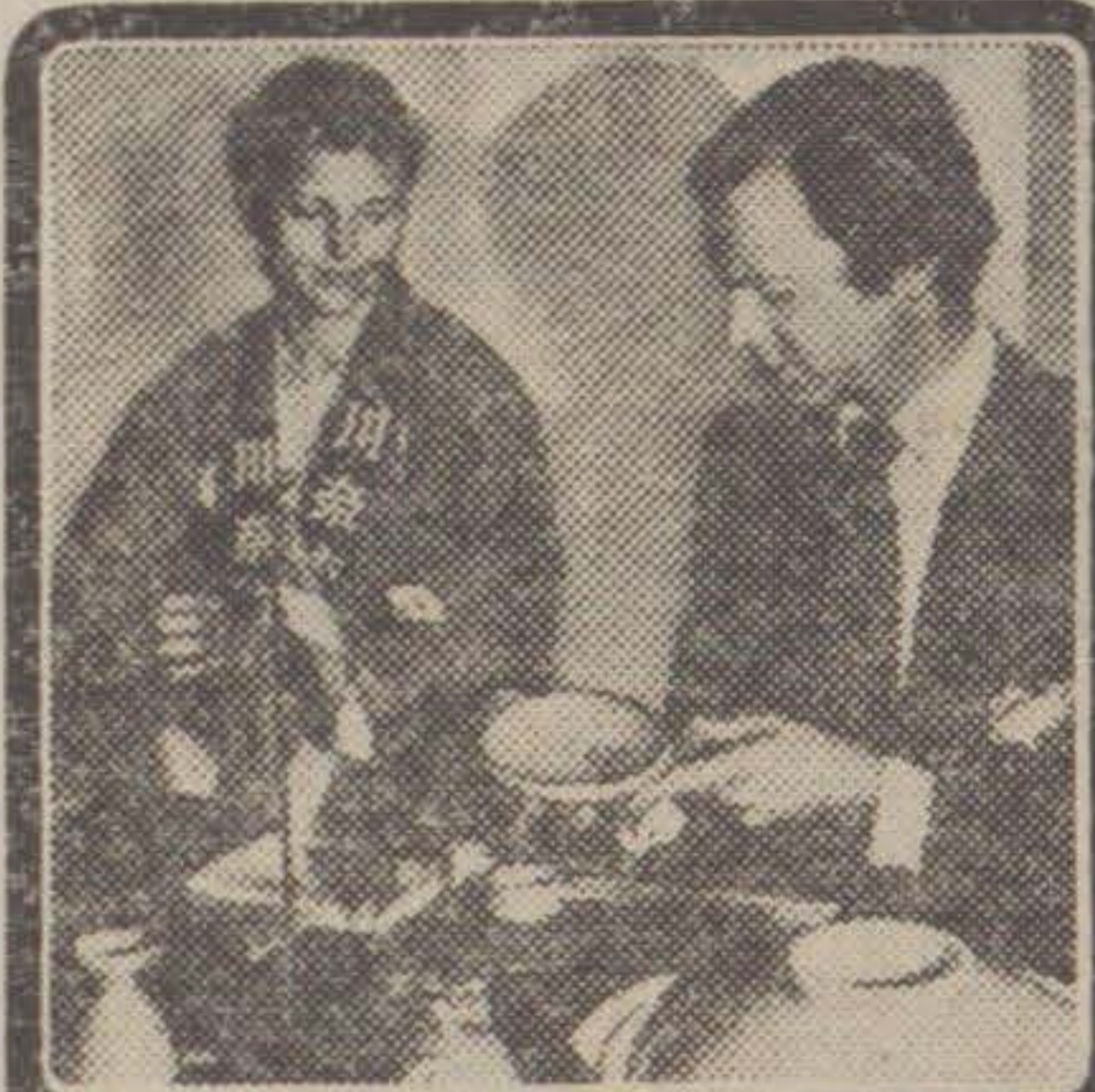
Kungen och Silvia i Japan