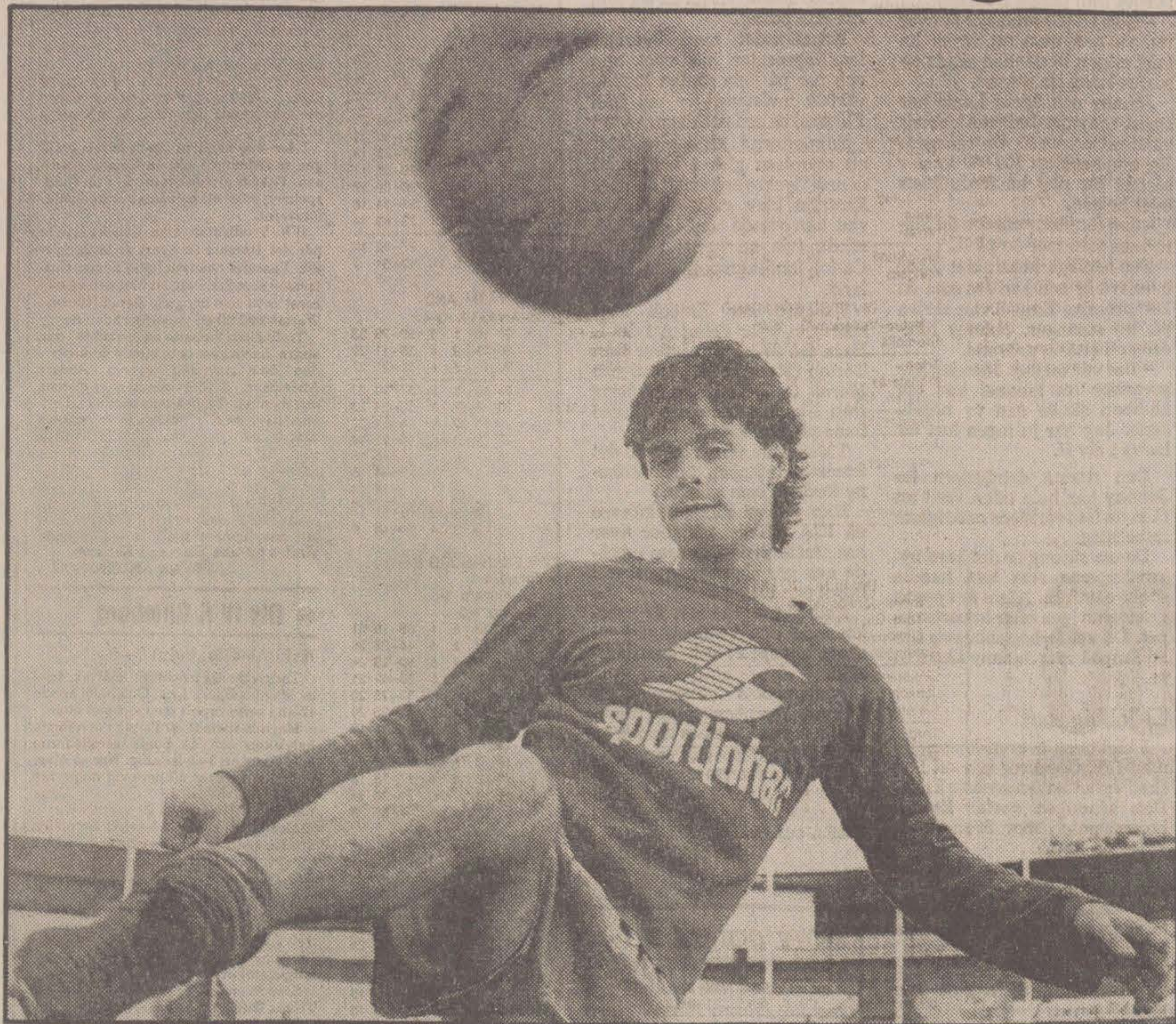
Nu är det dags för Örgryte i Europacupen. Anders Limpar har ingen respekt för de östtyska motståndarna. Avancemang i cupen och en plats i OS-laget är Limpars stora mål för säsongen.

I fjol spelade han i div I för Brommapojkarna, på onsdag springer han ut på Ullevi i Europamatch för Örgryte mot Dynamo Berlin, östtyska mästarna. Men det är inget som imponerar på Anders Limpar, 21 år som är väldigt medveten om sin egen kapacitet och kunskande.