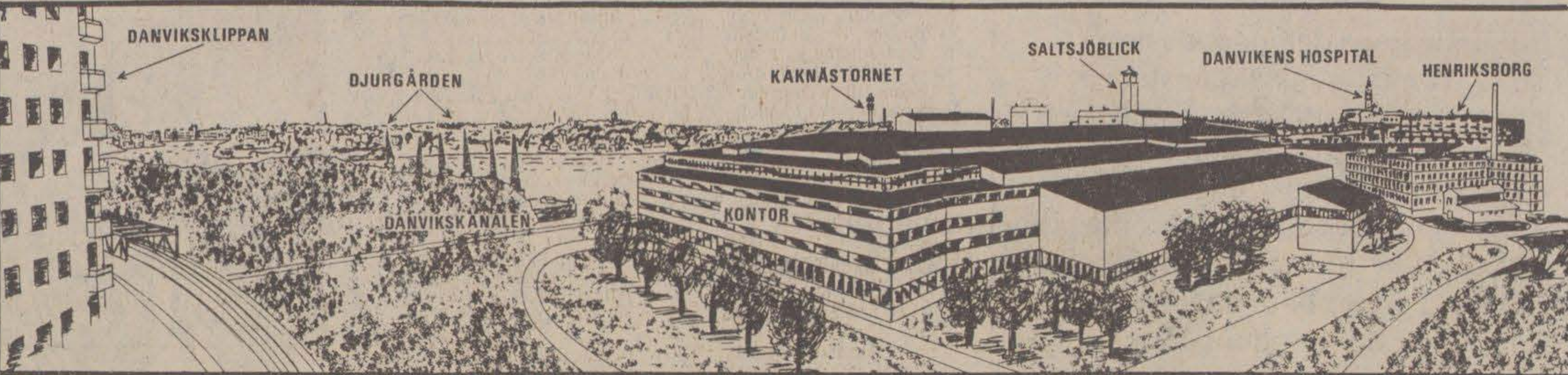
...ett mastodonthus, som är 45 meter högt och 160 meter långt. Från kvarnen bakom bageriet leds mjölet i pipeline till översta våningen i bageriet, på nästa våning bakas, därunder paketeras och därefter lastas direkt på lastbilarna.

trafik i området. De ca 100 brödbilarna ska köra ut med bröd till affärerna i Stor-Stockholm två gånger om dagen.