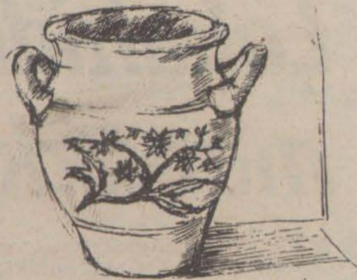
□ Syltkruka som Gustavsberg tillverkade i tio storlekar i nära 100 år.