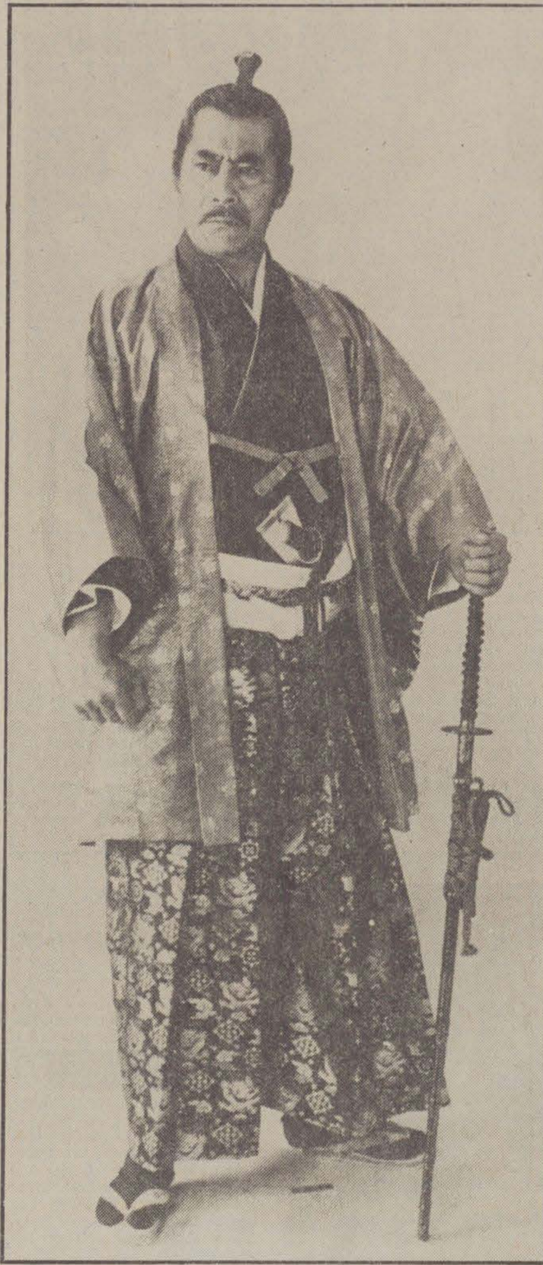
Skådespelaren Toshiro Mifune är sinnebilden av den japanske samurajen med hårknuten, sidenkläderna och svärderna.