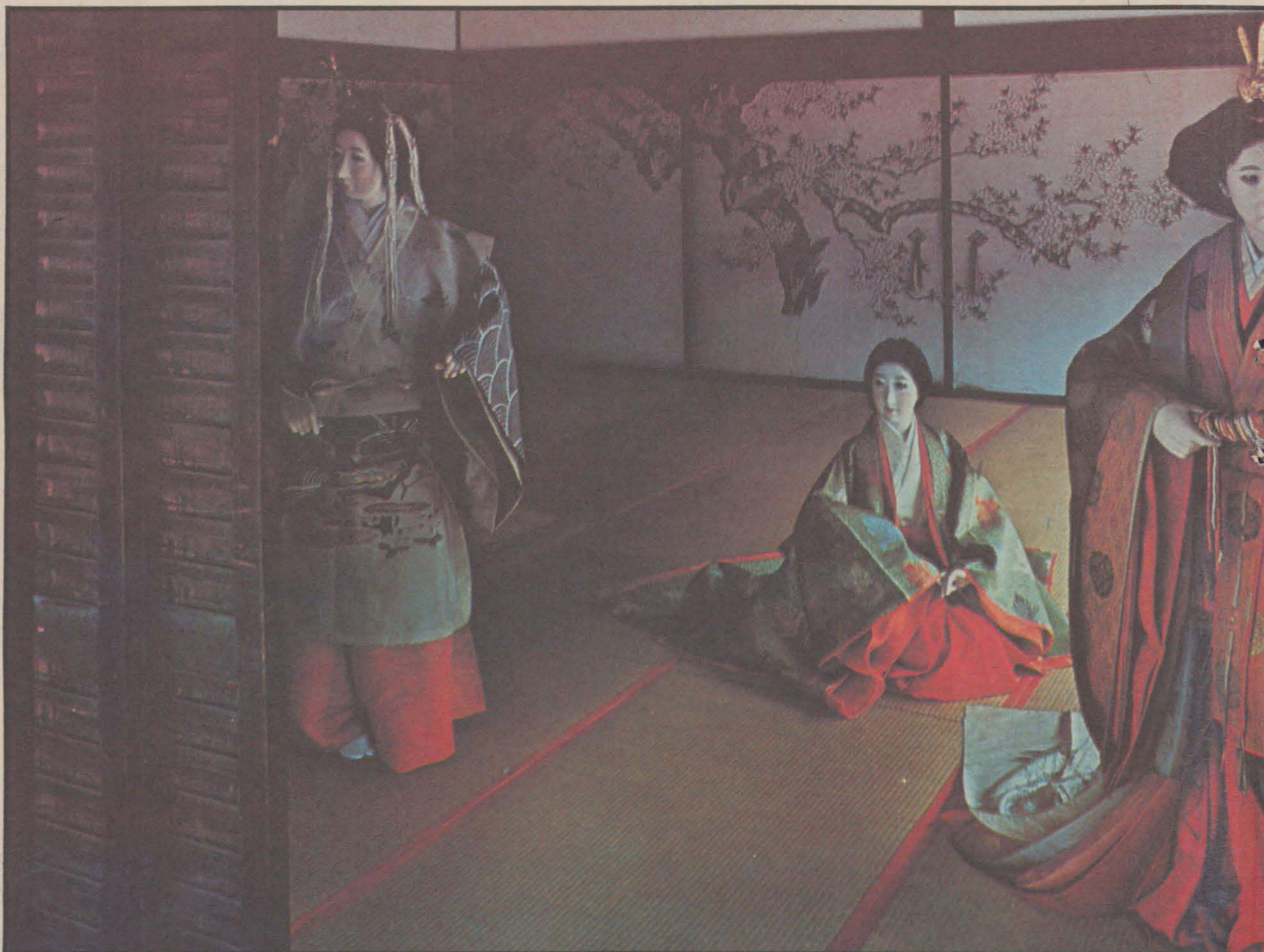
Geishans roll har förändrats genom historien. Ursprungligen var hon en glädjeflicka men när prostitutionen förbjöds under vårt århundrade förvandlades hon uteslutande till en värdinna som förvaltar den japanska traditionens invecklade bords- och umgängesritualer. Hon klär sig i dyrbara kimonos av siden, sätter upp sitt hår i en knut och målar sitt ansikte i starka kontrastrika färger.