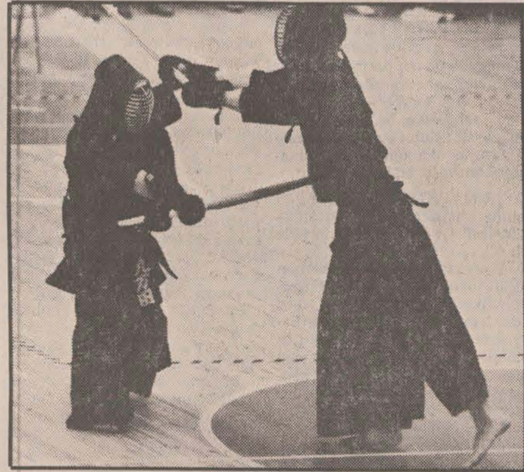
Kendo utövas med mask och andra skydd för att de stridande inte skall göra varandra illa. Hiskeliga vrål ingår i spelet.

Att det var så mycket jobb bakom den här halvtimmen ha-