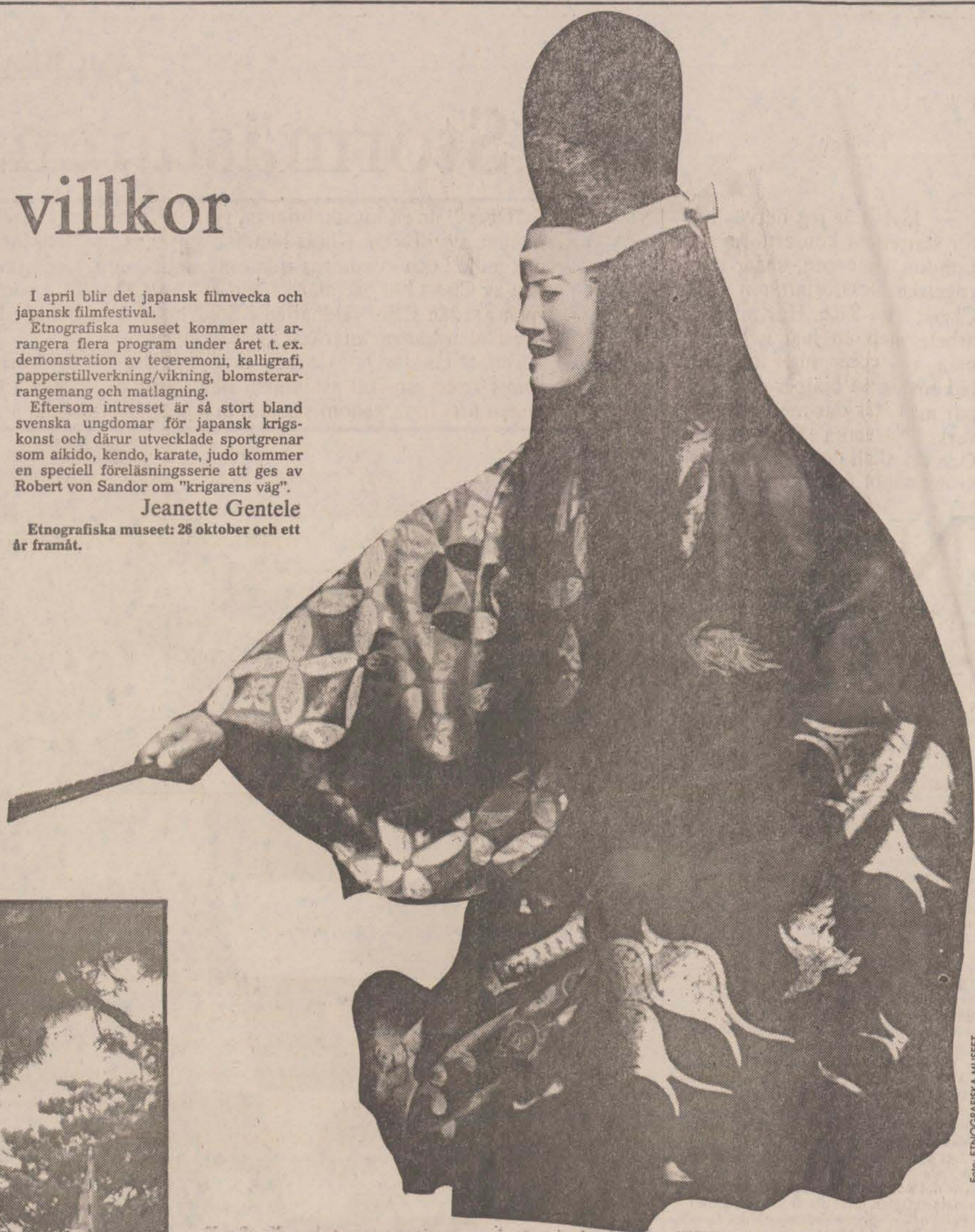
Skådespelaren Hisao Kanze i no-spelet "Michimori" av Iami.

Etnografiska museet: 26 oktober och ett år framåt.