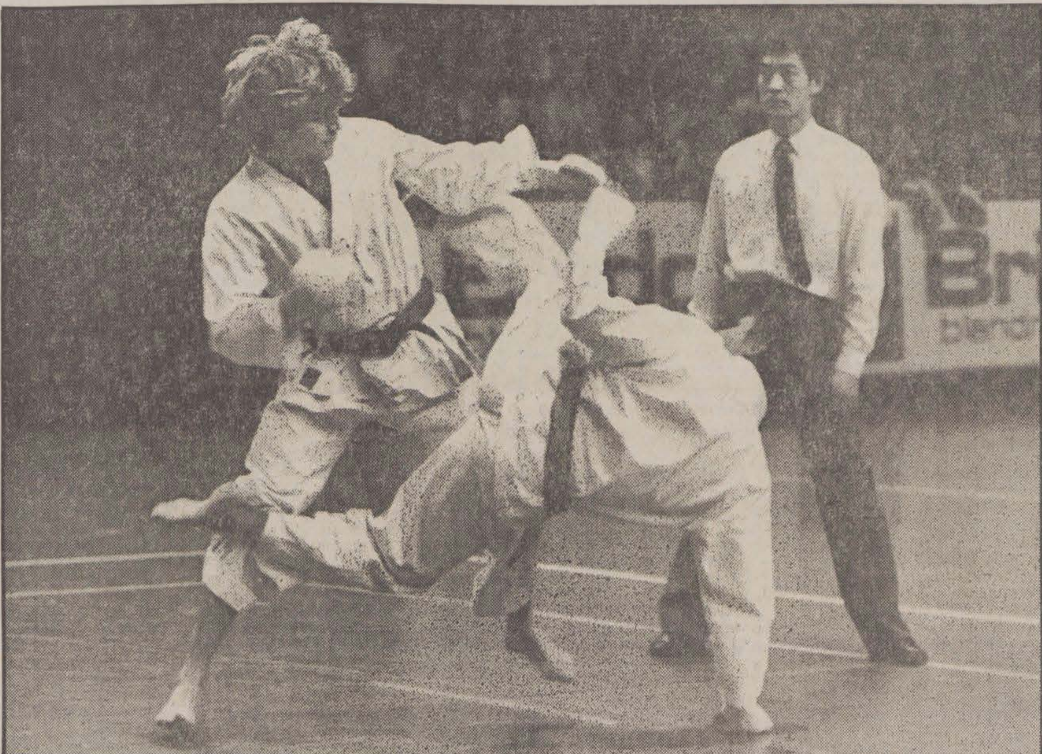
Karate ser ut att vara en farlig sport med sparkar och slag. Det är det inte alls, säger utövarna, som på lördagen hade uppvisningar och landskamp i Eriksdalshallen. Man bara mättar sparkar. Några träffar skall det inte bli.