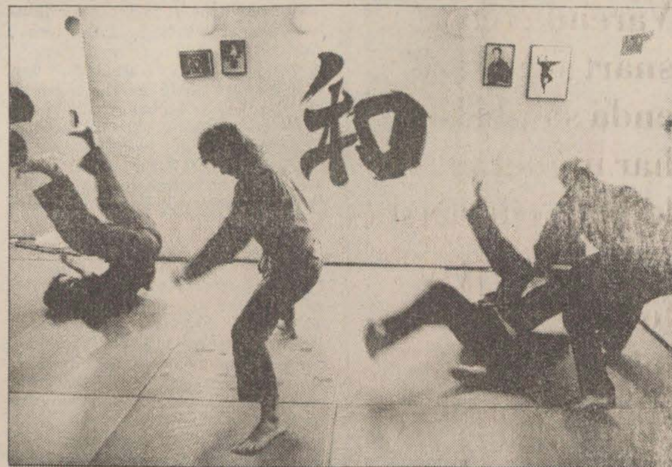
Ninjutsuträningen är mjuk och präglad av ödmjukhet mellan varandra. "Karate-folket tycker att vi äter chokladkakor och gör kullerbyttor."