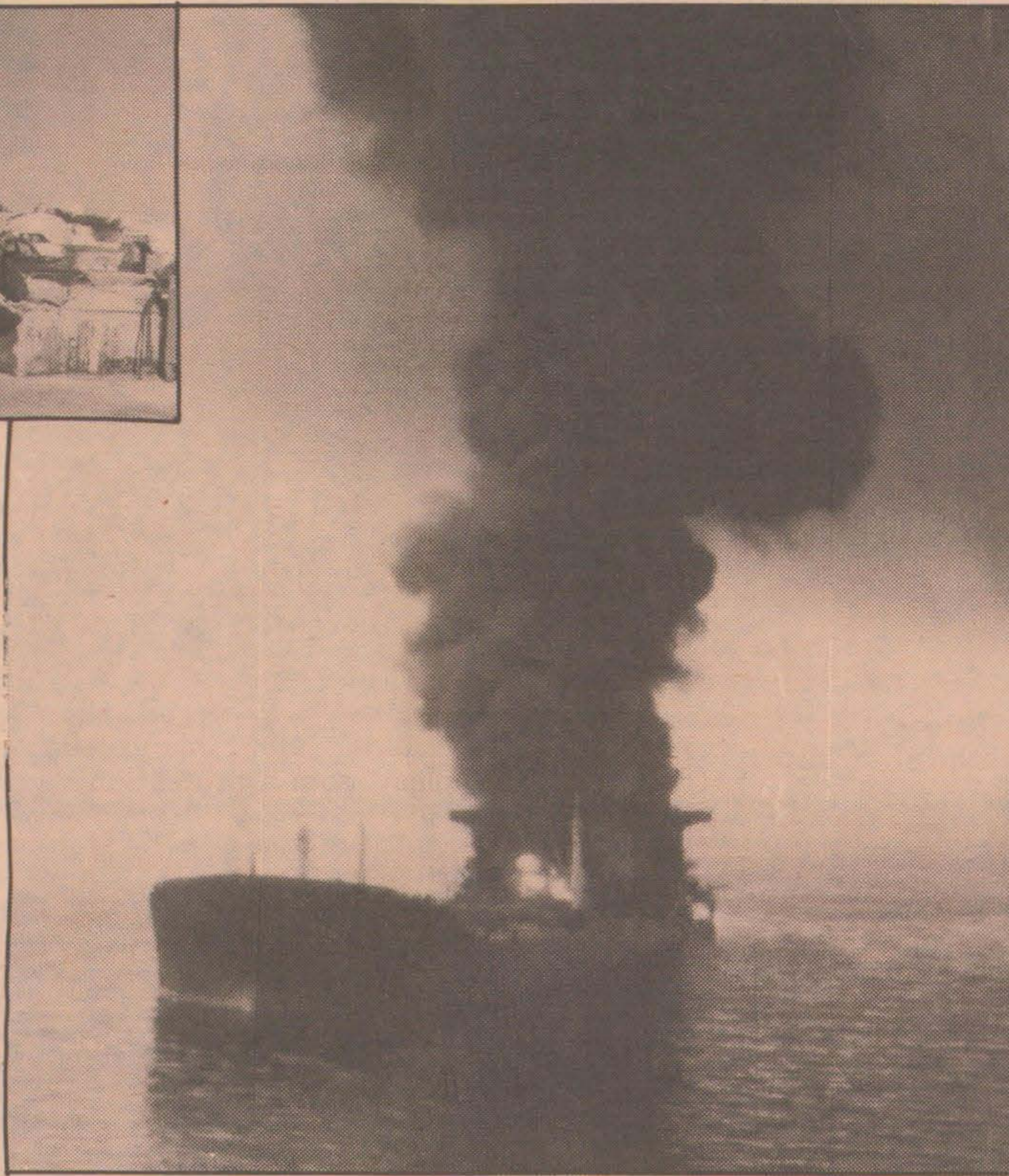
Kriget har hittills vållat oreparerbara skador på 140 fartyg. Den saudiarabiska tankern Al Ahoud på bilden träffades av raketer i maj i år.

oktober 1985), som är kopplat till Barricade Naval Decoy System. Uppgifter publicerade förra året uppgav att systemet vid tester uppnått 70 procents effektivitet. Pris: 2,5 miljoner kronor.