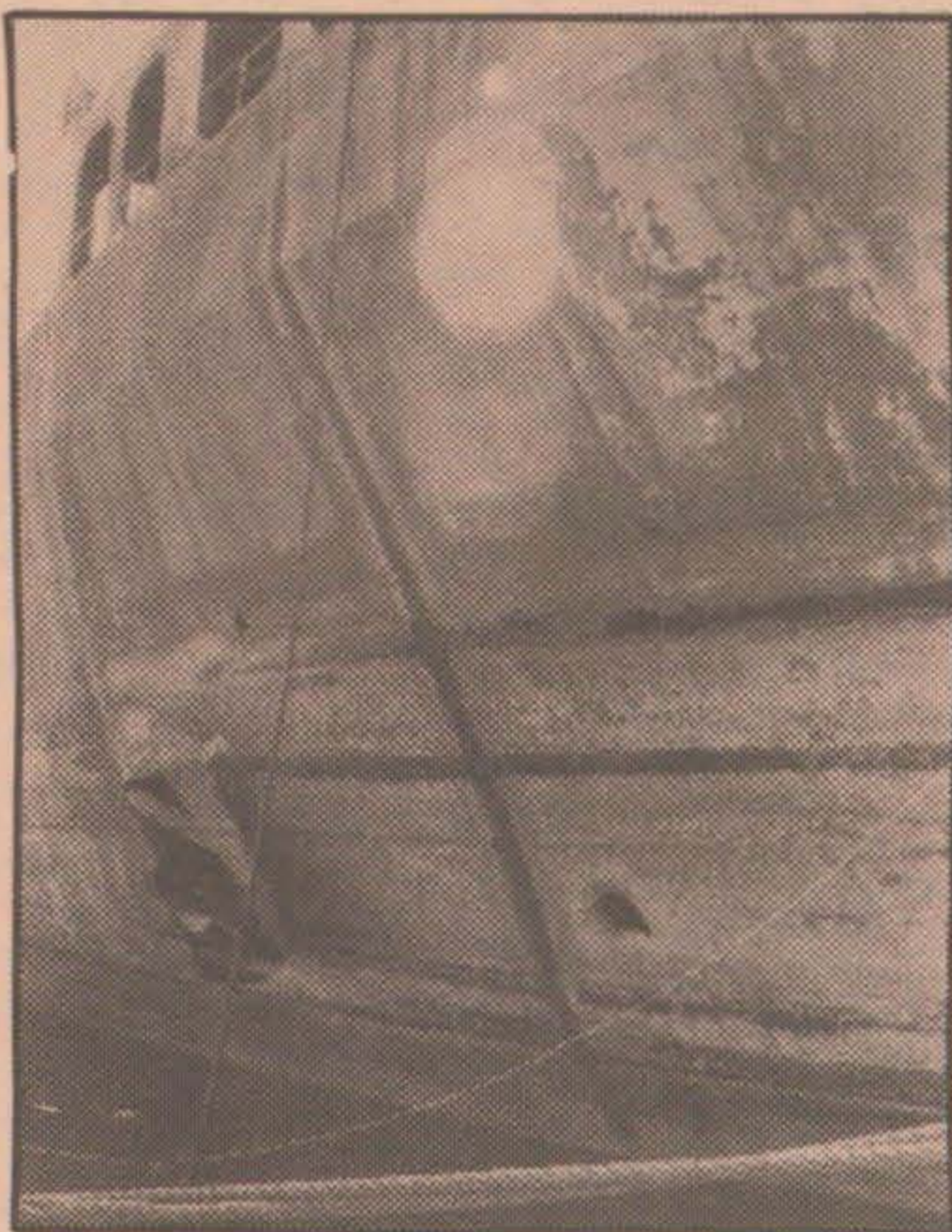
Ett hål i en tankers skrov orsakad av en fransk Exosetrobot avfyrad av irakiskt flyg.