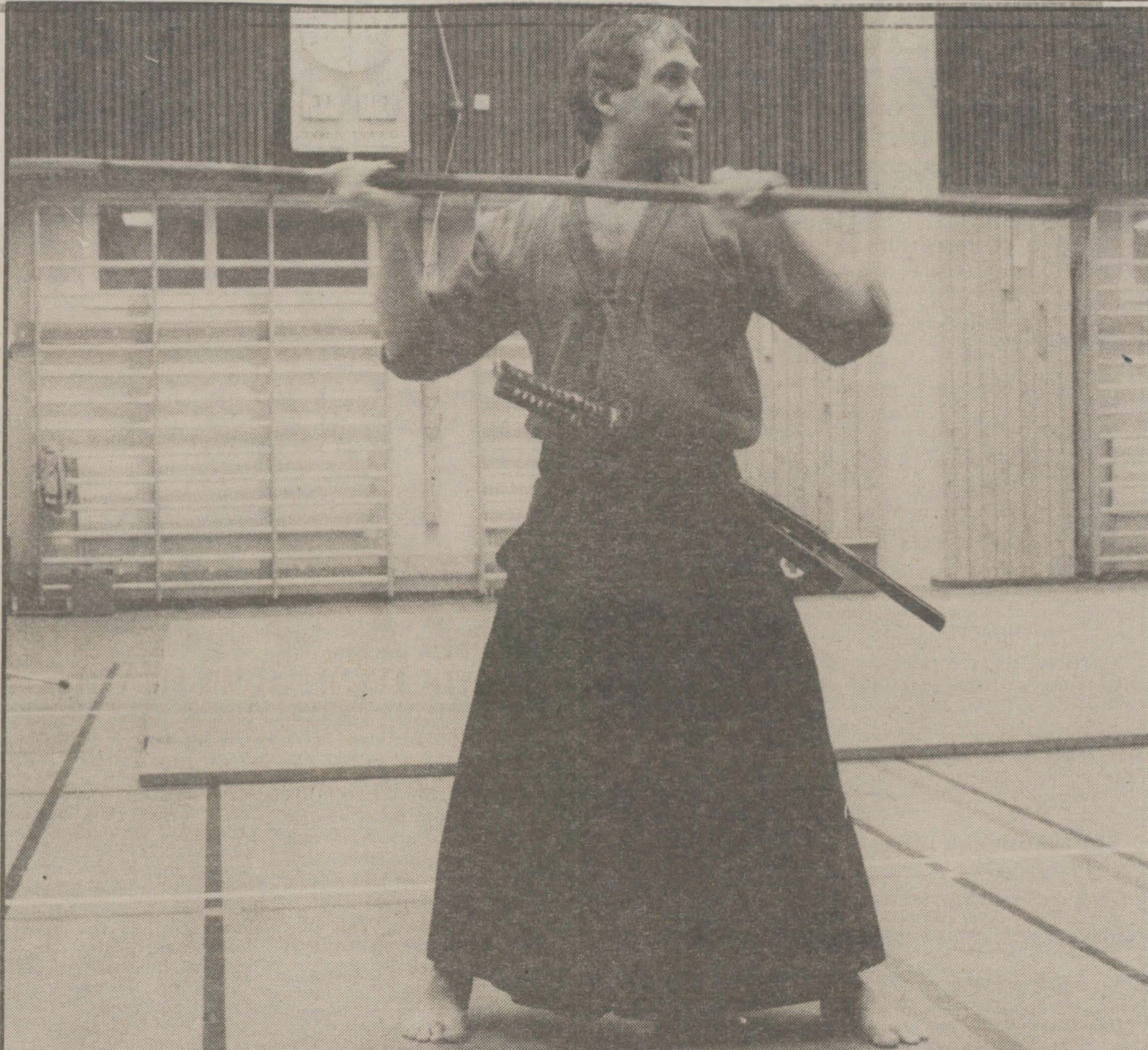
Kendo är japansk svärdfäkting med tydliga rötter i samurajtraditionen. När medlemmar i Vällingby kendoklubb visade olika moment fördes tankarna till Kurosawas filmer.