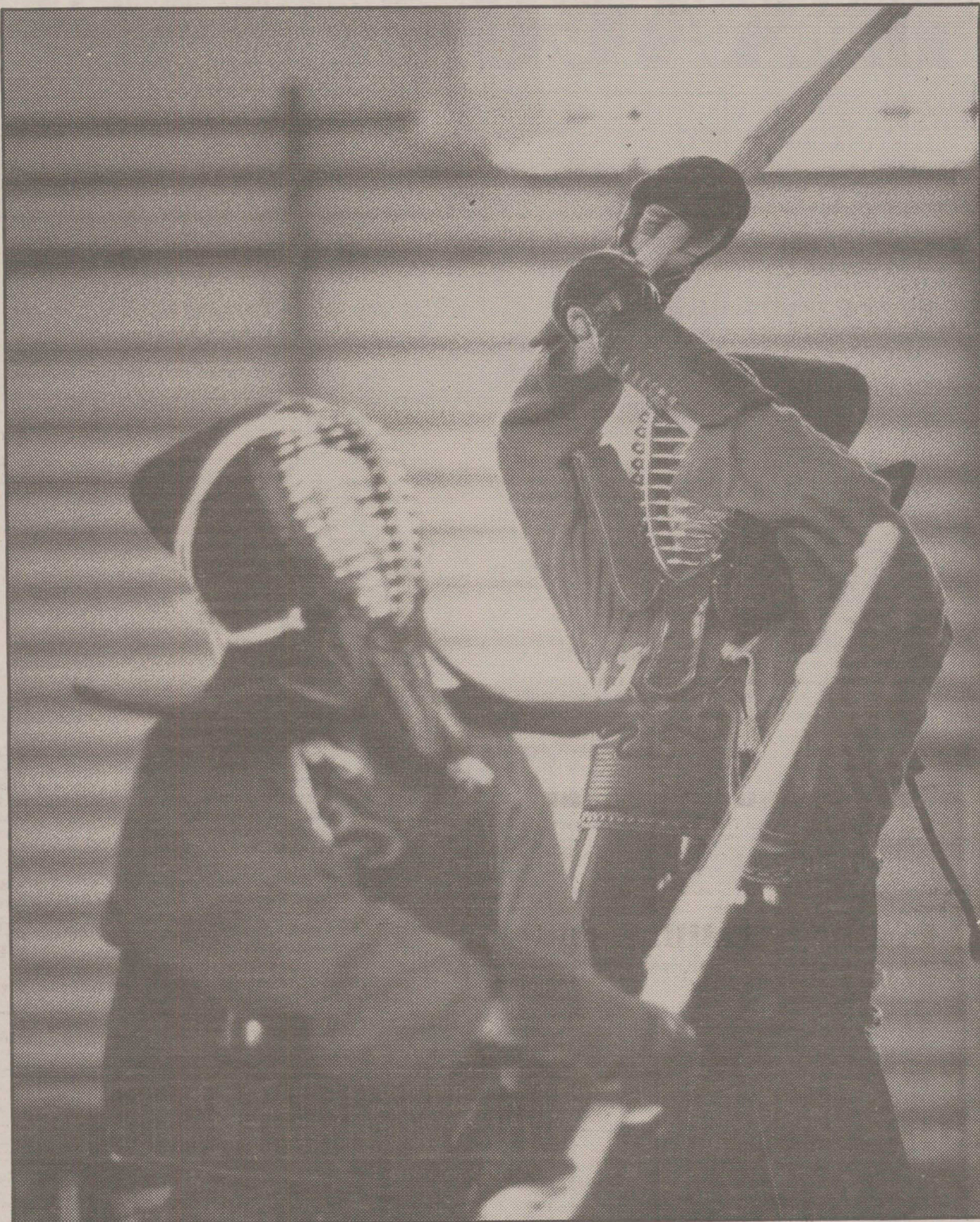
Kendo är en japansk kampsport med månghundraåriga traditioner. I Sverige, som nästa helg arrangerar EM, finns idag 400 utövare. Och sporten är på stark fram-marsch.

Men det blir inte lätt. Svenske mästaren heter nämligen Kinitchin Kamayatsu – just det, en invandrad japan. . .