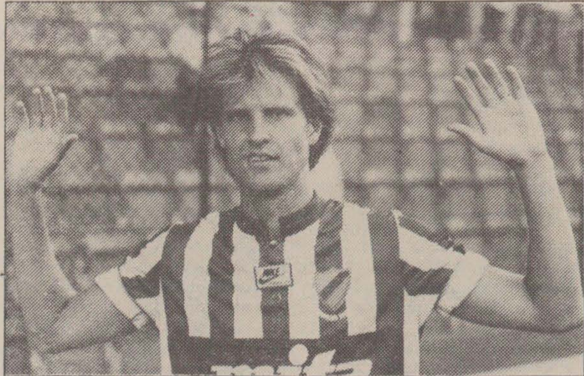
Såg inte Djurgårdstipsaren Skoogen för alla träden?