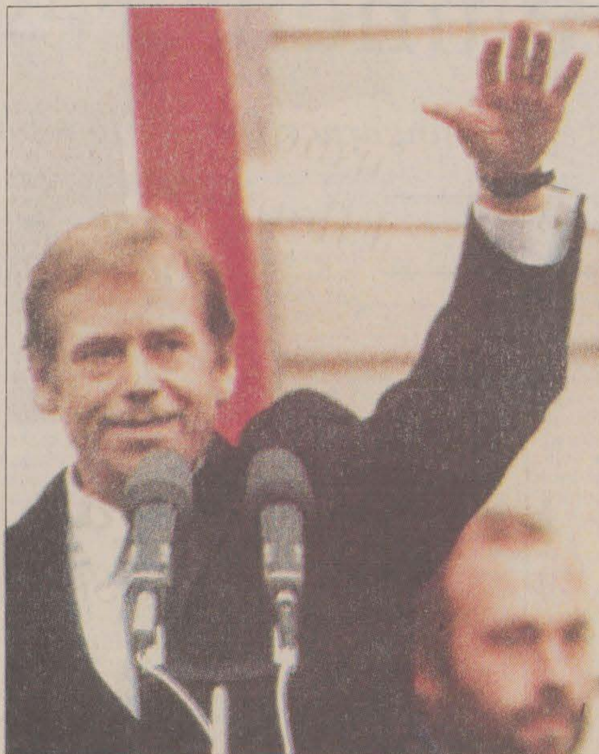
Den nye Havel. Dissidentröjan ersatt med presidentkostym och kortege med superpotenta BMW.

I Polen och Tjeckoslovakien kom de oppositionella medborgarrörelserna till makten med en retorik som hämtats från den demokratiska oppositionens antipolitiska språk, ett språk som präglas av