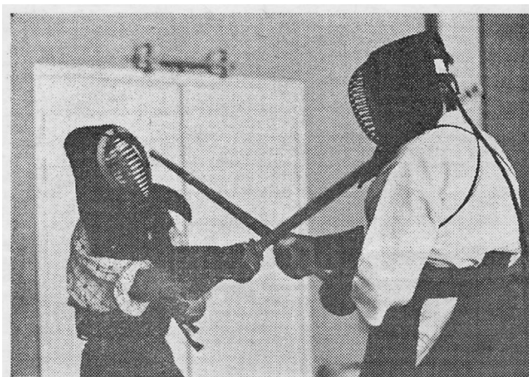
En av Budo-sporterna är Kendo och den utövar man som på bilden.