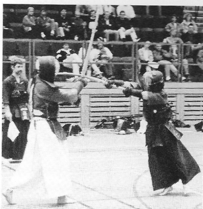
Finalen mellan Momiyama och Södergren.

Dessa två gick helt överlägset igenom tävlingen. När poolspelen var klara återstod 7 kendokas i semifinalpoolerna. Samtliga 7 är Dangraderade och kvaliteten på