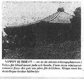
NIPPON BU DOKAN — en av de största träningsplatserna i Tokyo för bländant judo och ken-do. Enom stora träningsutövare från det gäst som finns för dojos. Vilgen stam budokan brukar hålla här.