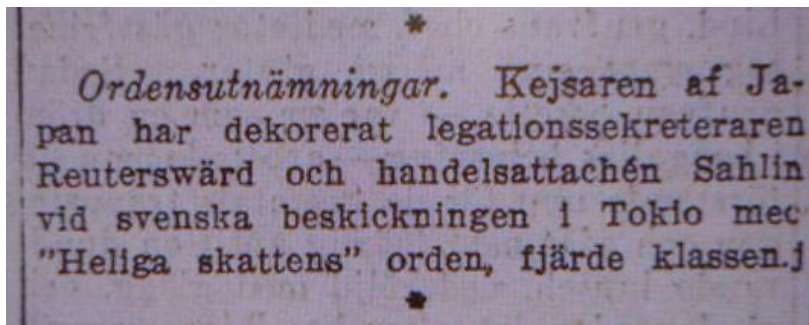
Foto 2 - Note in Swedish newspaper about the Japanese order (SvD 1913-02-06)