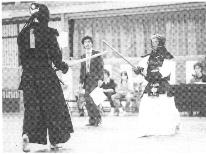
Lag SM Kendo

Trots detta vann Södra över Vällingbys lag 1.