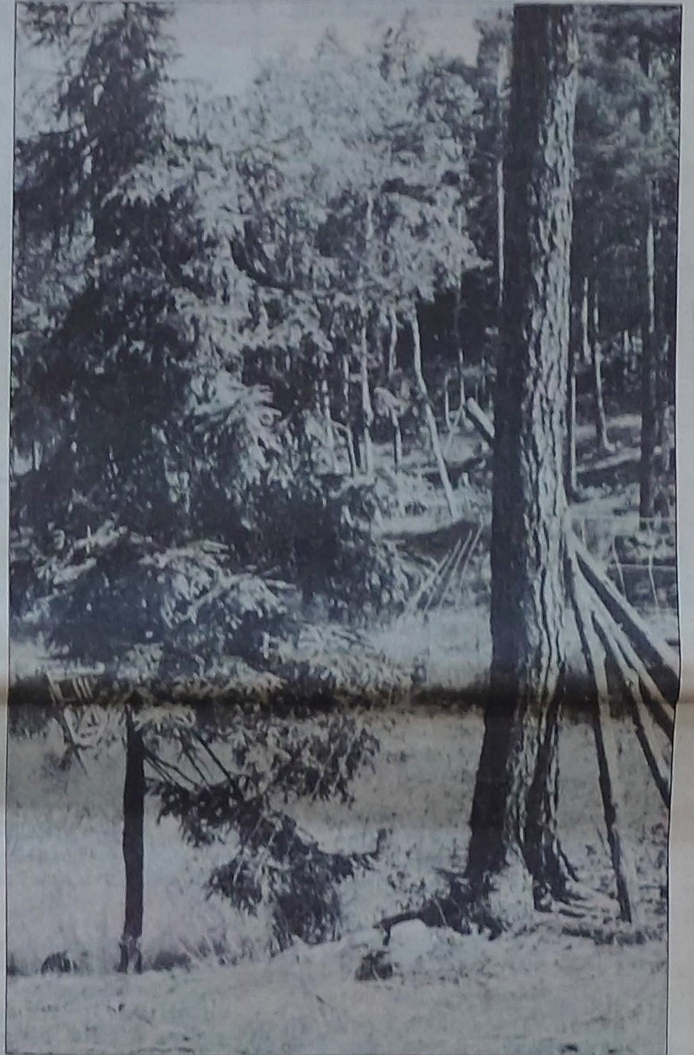
Molstabergs viltpark gör knappast någon besökare glad. Tra- siga staket, tomma vilthägn och ett eller annat vildsvin samt mufflon väntar den betalande besökaren.