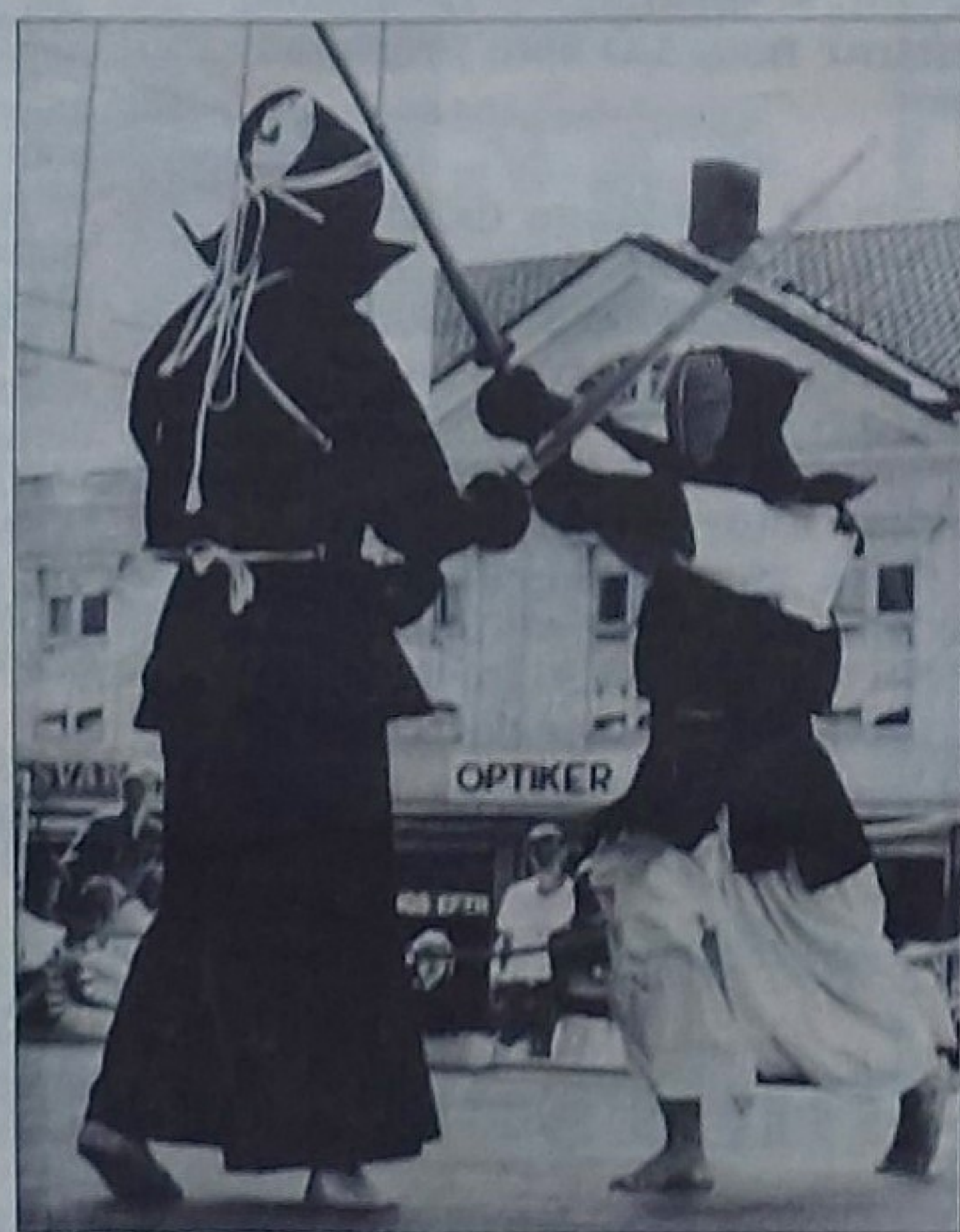
Med våldsamma skrik kastar sig mot- ståndarna över varandra och utdelar hugg mot huvud, handled, strupe och bröst.