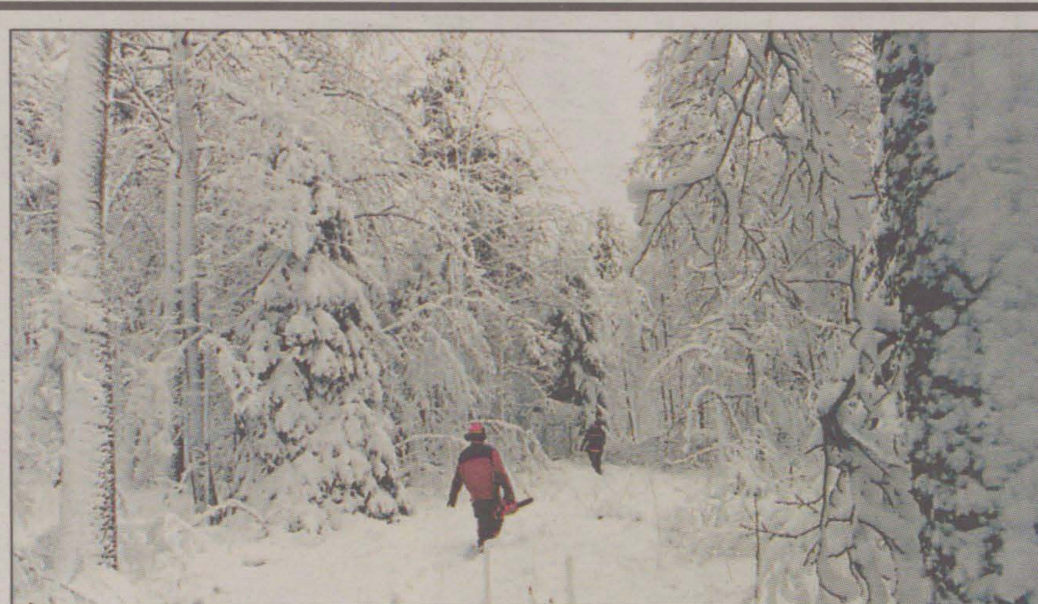
Om bara kraftledningsstolparna vore högre skulle strömbrottet bli både färre och kortare.