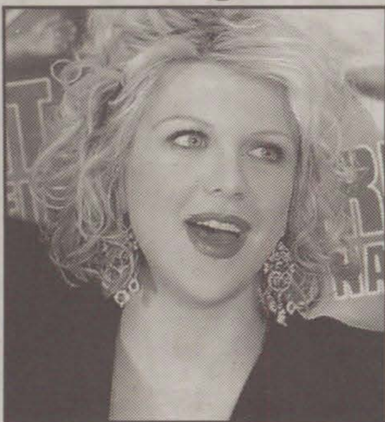
Courtney ska rocka igen.

Courtney Love hade en stor roll i Milos Formans "Larry Flynt - skandalernas man" förra året och fick mycket beröm.