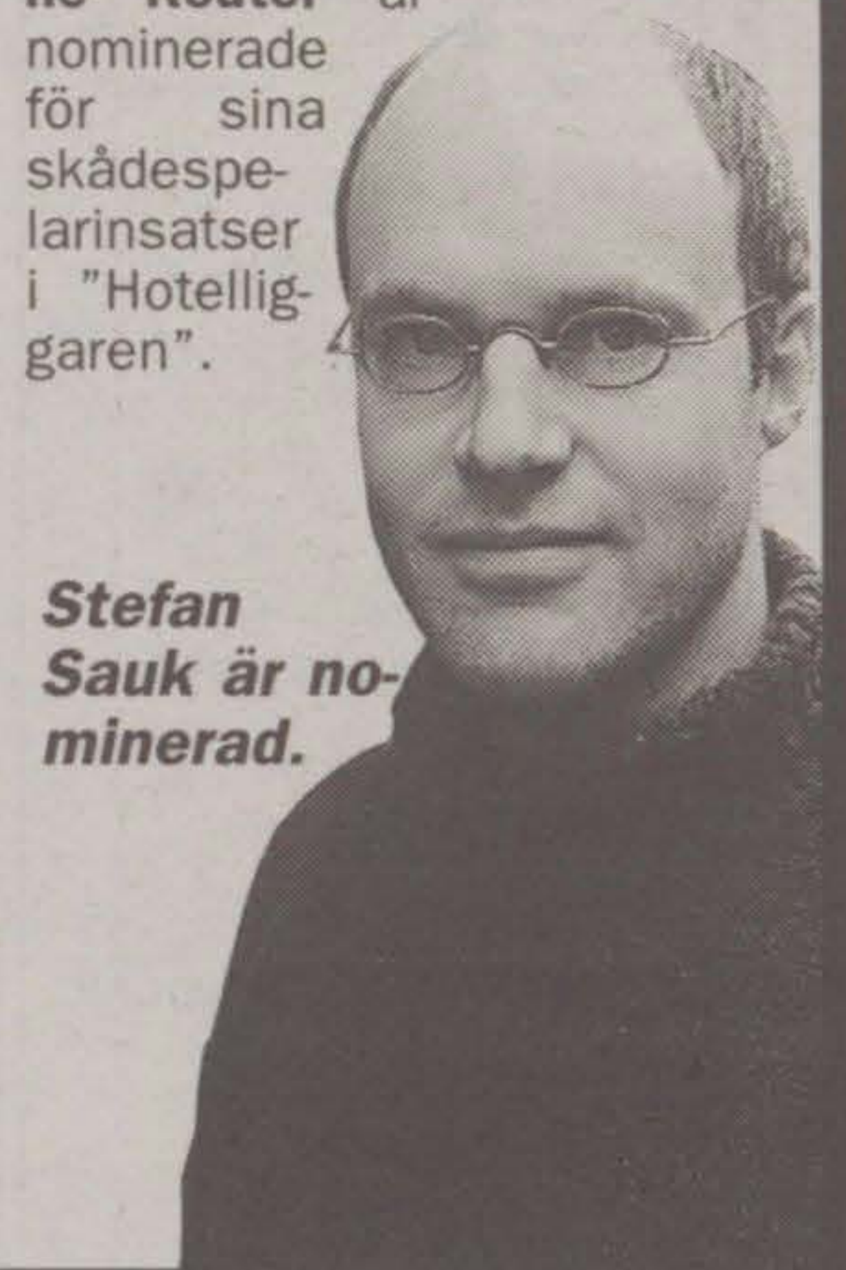
Stefan Sauk är nominerad.

Johan Rheborg och Suzanne Reuter är nominerade för sina skådespelarinsatser i "Hotelligaren".