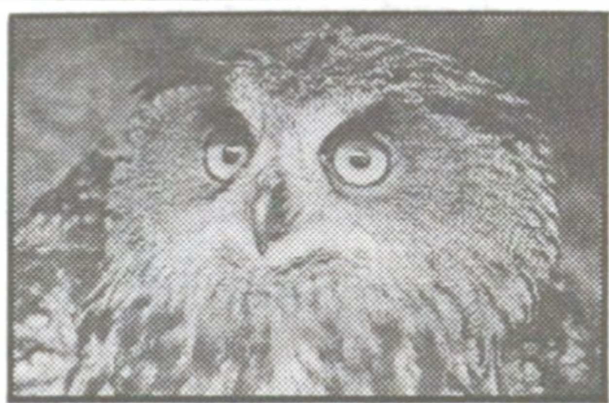
Kattvän – eller katthatare?