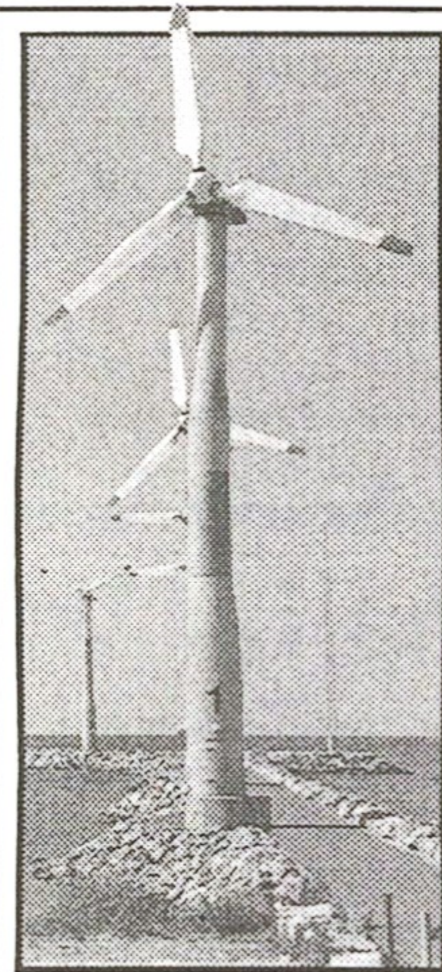
Det har blåst mer än på länge senaste tiden. Men den kalla blåsten har gett värme inne i stugorna.