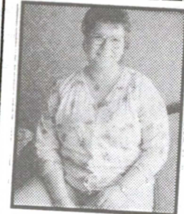
● 130 kilo