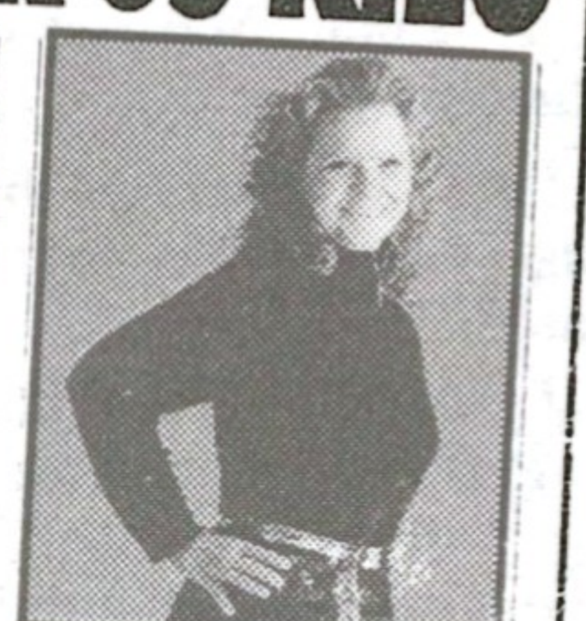
● 65 kilo