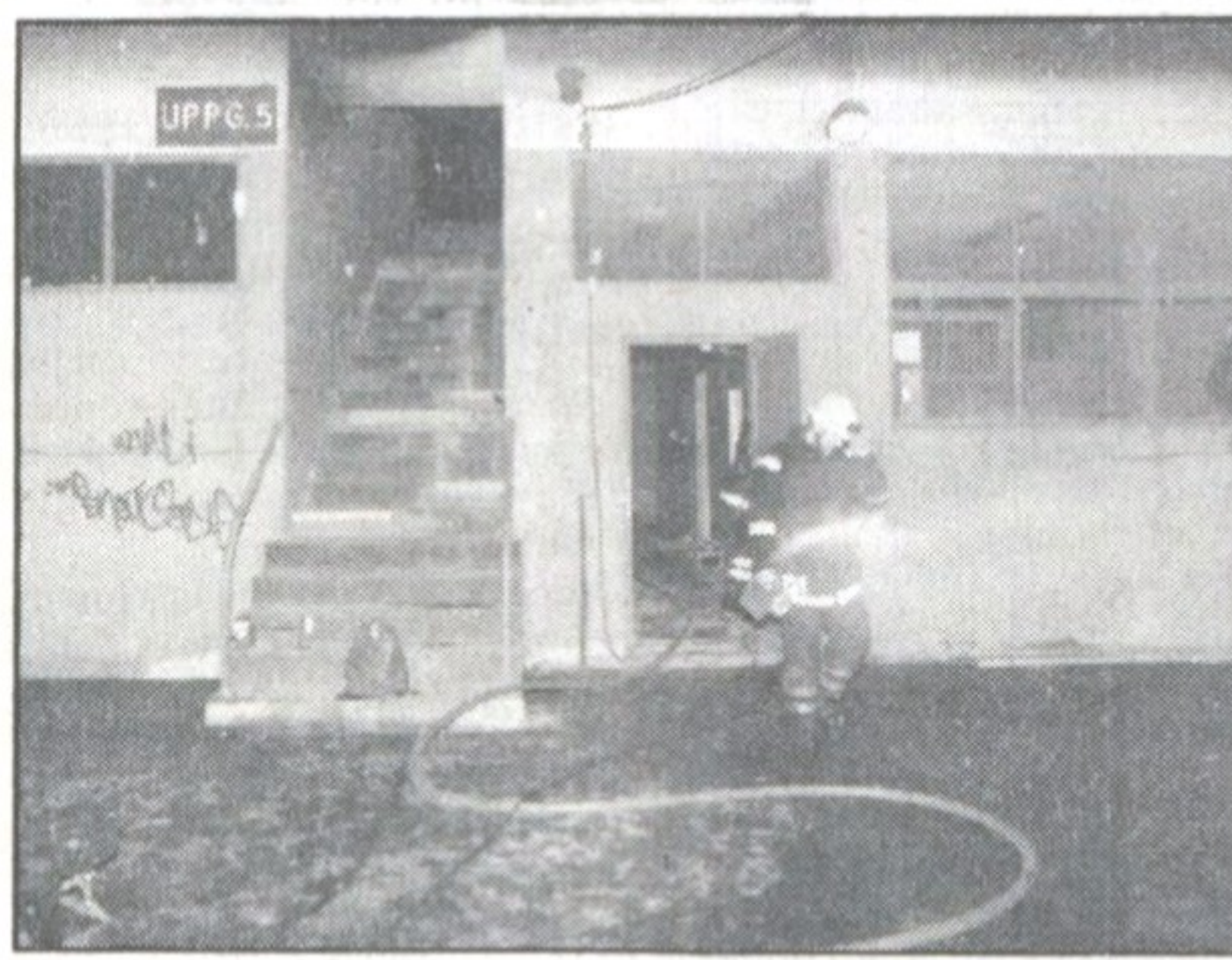
Snabbsläckt. Branden på Gamla Ullevi påverkar inte ombyggnadsplanerna, till våren ska arenan stå klar för allsvensk fotboll.

På tre månader ska köerna till kranskärlsröntgen och ballongvidgning av kranskärl vara borta vid Sahlgrenska sjukhuset i Göteborg. Det sker genom att personalen frivilligt jobbar extra under kvällar och helger. Åtgärden är ett led i att möta vårdgarantins krav på att ingen patient ska behöva vänta mer än tre månader på vissa behandlingar. De fackliga organisationerna ställde sig mycket positiva till att låta personalen jobba extra. (TT, Göteborg)