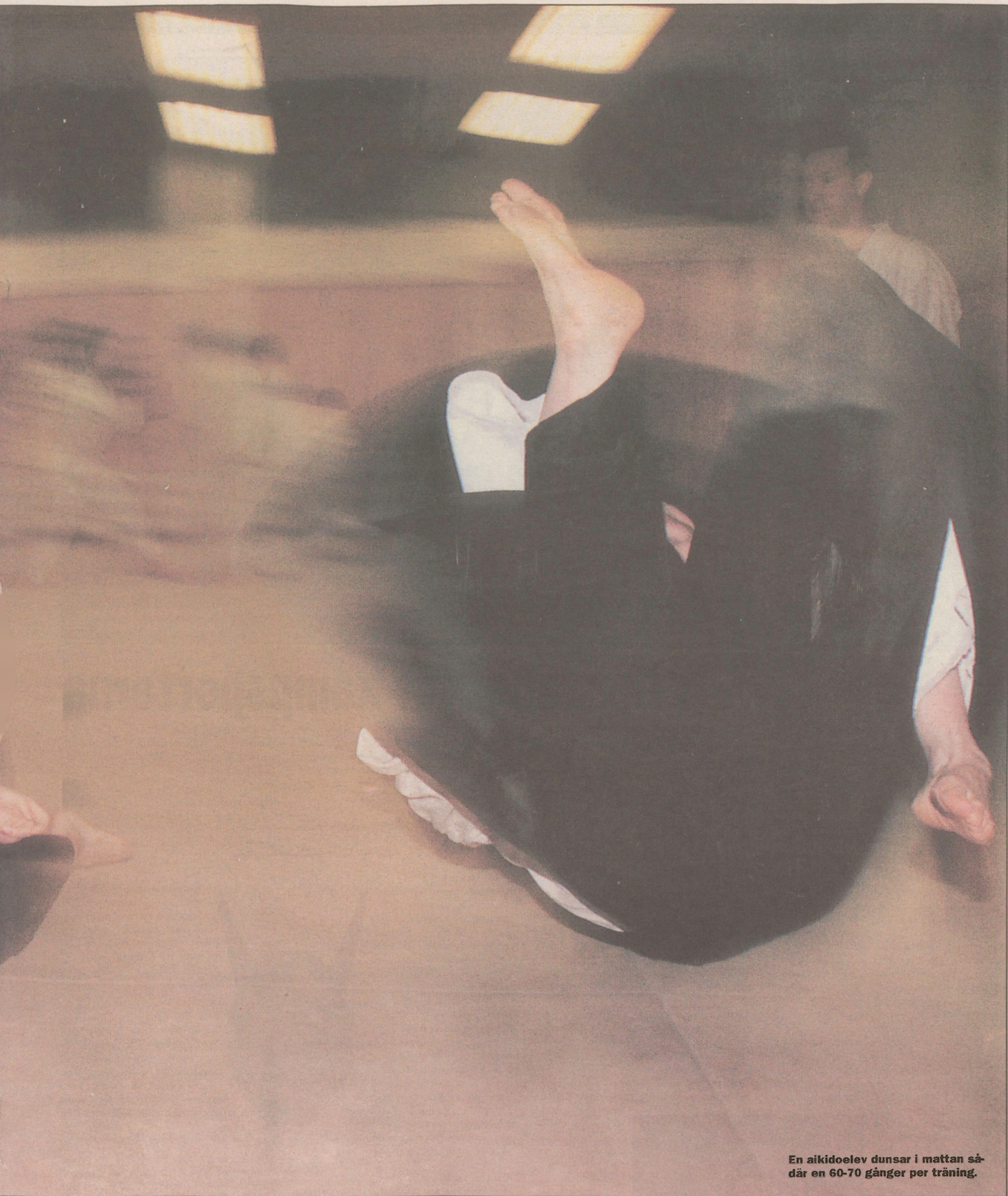
En aikidoelev dunsar i mattan så- där en 60-70 gånger per träning.